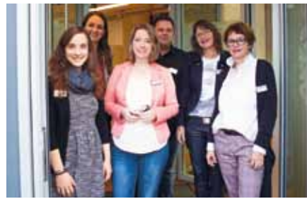
Inklusionsexperten: Die Mitarbeiter der neuen Beratungsstelle „Alexianer 360°“ im Zentrum Kölns

KÖLN. Die Alexianer Werkstätten GmbH eröffnete Ende vergangenen Jahres gemeinsam mit der Alexianer Köln GmbH ihre neue Beratungsstelle mit dem Namen „Alexianer 360°“ im Herzen der Domstadt.