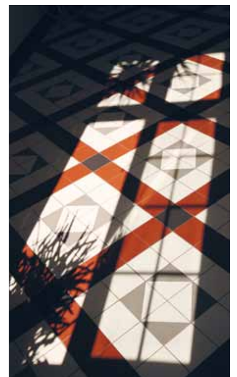
Lichtspiele im Haupthaus

Verschiedene Kunstformen faszinierten den 1983 in Człuchów (Polen) geborenen Mailer schon früh: „Ich interessierte mich sowohl für Musik als auch für Mode und bildende Kunst“, so der Enddreißiger, der unter anderem ein Floristikdiplom besitzt. Nach dem Abschluss der weiterführenden Schule hatte Mailer zunächst Modedesign studiert, bevor er den Entschluss fasste, sein jetziges Studium in der Kunstabteilung der Universität der Geistes- und Wirtschaftswissenschaften in Łódź aufzunehmen, das er im Fernstudium absolviert. ✕ (ekbh)