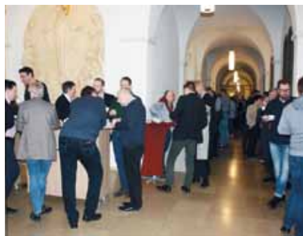
Drei Tage Gespräche, Besinnung und Beisammensein in Bensberg

Austausch und Begegnung beim Geistlichen Jahrestreffen