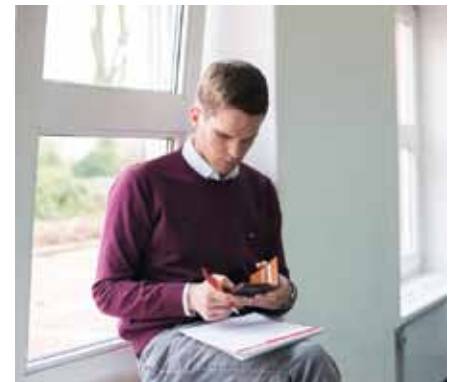
Digitale Wissensdatenbanken mit aktuellen und geprüften Inhalten zu Medizin und Pflege

Deshalb bieten die Alexianer ihren Mitarbeitern mit Thieme eRef seit 2019 beziehungsweise CNE bereits seit 2015 umfangreiche digitale Wissensdatenbanken mit aktuellen und geprüften Inhalten zu Medizin und Pflege an. Diese Datenbanken können und sollen genutzt werden, um das eigene Wissen zu erweitern und zu vertiefen und damit die ei-