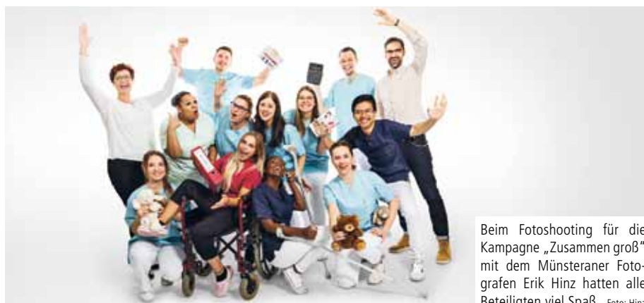
Beim Fotoshooting für die Kampagne „Zusammen groß“ mit dem Münsteraner Fotografen Erik Hinz hatten alle Beteiligten viel Spaß.

Clemenshospital, Raphaelsklinik und Alexianer Münster starten gemeinsame Ausbildungskampagne