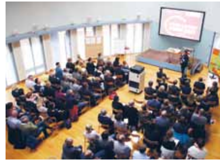
Volles Haus und gespannte Blicke bei der Zukunftswerkstatt Bildung und Pflege in Berlin

Seit 2014 widmen sich die Alexianer in der Zukunftswerkstatt innovativen Gesundheitsthemen und den Herausforderungen einer modernen Pflege. Diese Veranstaltung vermittelt zum einen modernes Wissen und fördert zum anderen den Austausch zwischen Experten und Führungskräften. „Wir wollen die Innovationstreiber der Pflege identifizieren und in unseren Arbeitsalltag integrieren“, so