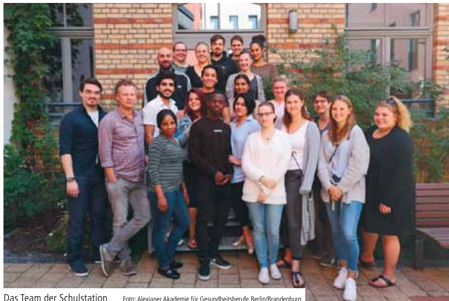
Das Team der Schulstation

Die Schulstation am Alexianer St. Joseph-Krankenhaus Berlin-Weißensee