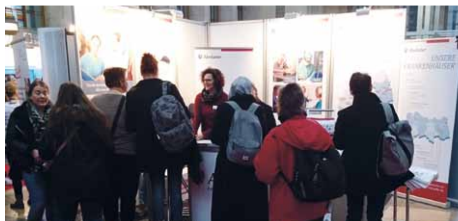
Ende November waren die Alexianer wieder mit einem Stand, exklusiv und unmittelbar an erster Stelle des langen roten Teppichs, auf der JobMedi in Berlin vertreten. Zur zweitägigen Veranstaltung strömten tausende Besucher und alle hatten direkt am Eingang ins Blick: die Alexianer