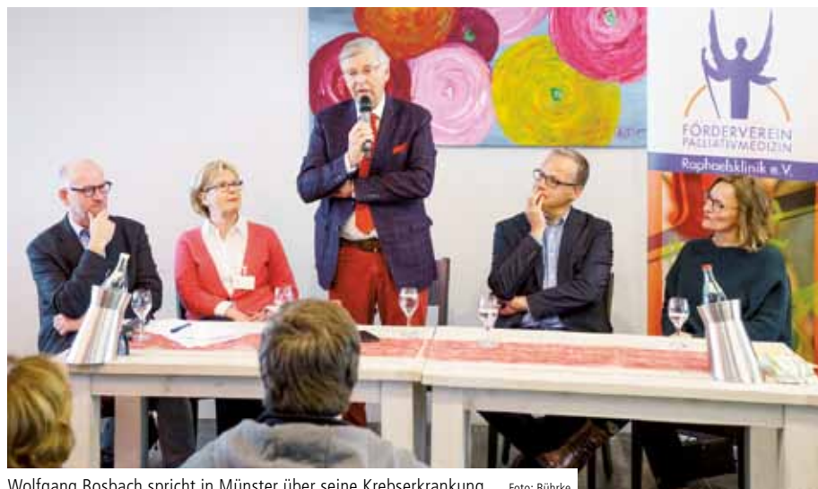
Wolfgang Bosbach spricht in Münster über seine Krebserkrankung