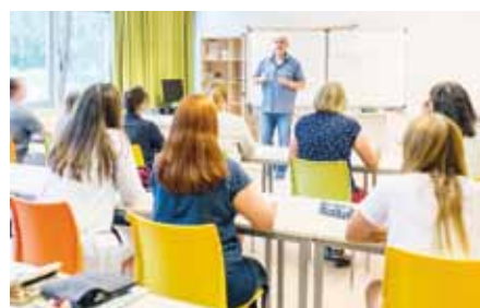
Die theoretische Ausbildung findet ab Oktober 2020 in der Pflegeschule der Oberlin Beruflichen Schulen statt

Strukturen für generalistische Pflegeausbildung geschaffen