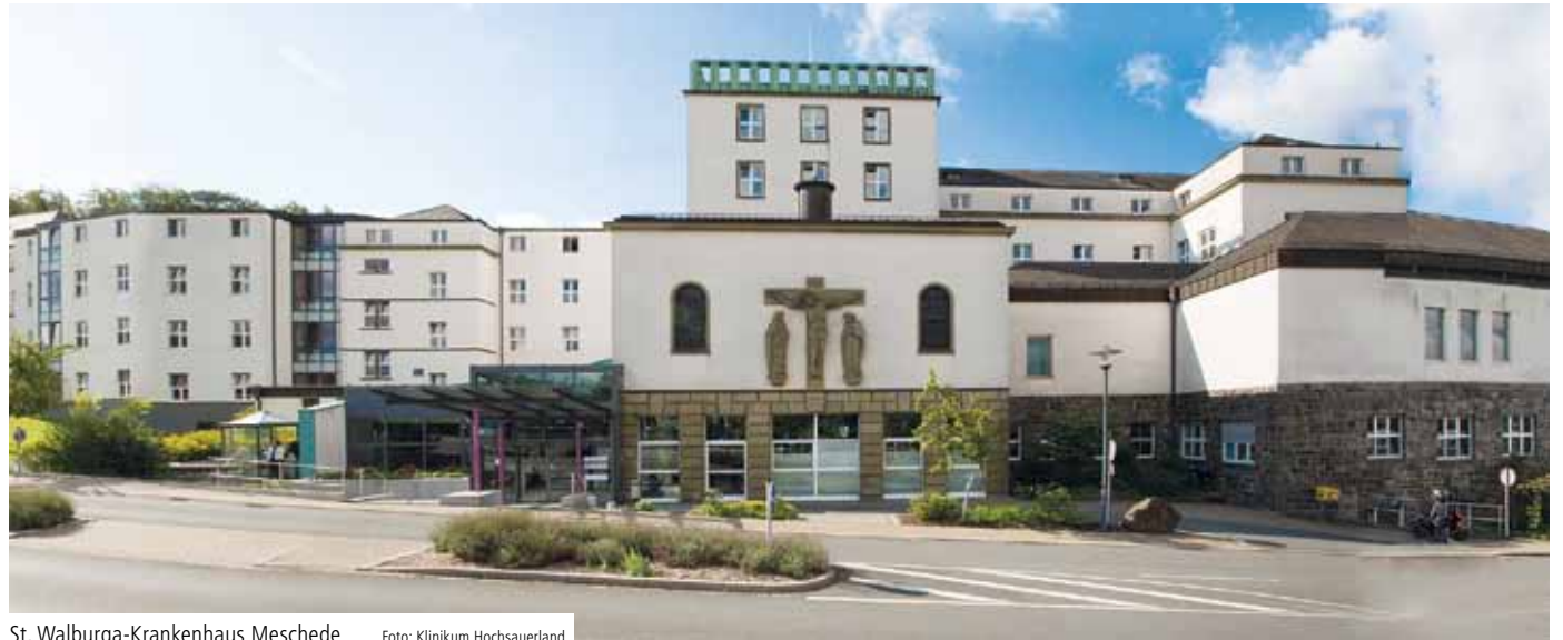
St. Walburga-Krankenhaus Meschede