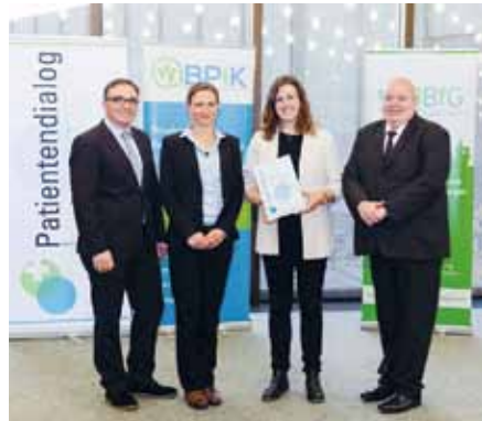
Platz drei für die Christophorus Klinik: Preisverleihung beim Award Patientendialog

Sieger im zum zweiten Mal verliehenen Award Patientendialog wurde das St. Elisabeth-Krankenhaus Köln-Ho-