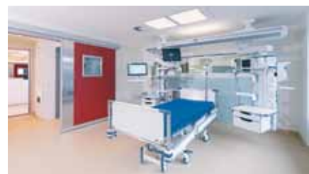
Die neue Intensivstation ist auch architektonisch eine echte Innovation