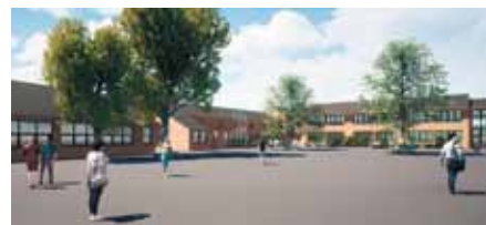
Ausblick auf das neue Schulgebäude nach Fertigstellung

ARNBERG. Mit vielfältigen Investitionen in eine gute eigene Ausbildung will das Klinikum Hochsauerland dem steigenden Fachkräftebedarf in der Pflege begegnen und hat hierzu bereits zusätzliche Ausbildungsplätze geschaffen. 113 Berufsstarter haben 2020 eine Pflegeausbildung im Klinikum Hochsauerland begonnen.