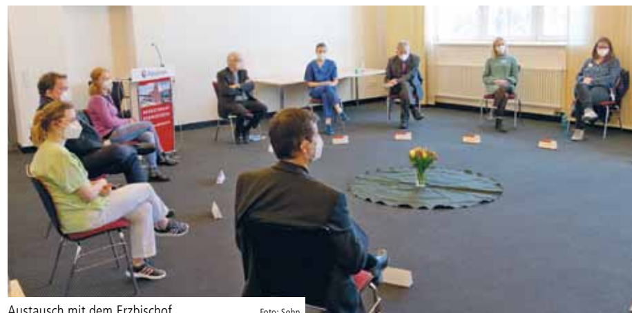
Austausch mit dem Erzbischof

Unvermittelt warf der Erzbischof dann die Frage in die Runde: „Worin sehen Sie die größte Zukunftsaufgabe dieses Krankenhauses?“ Die Antworten zeigten unterschiedliche Perspektiven, hatten aber eine gemeinsame Essenz: „Zu erhalten und weiterzuentwickeln, was uns hier so besonders macht!“