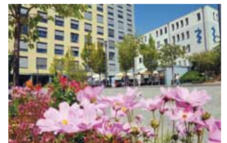
Bethlehem Gesundheitszentrum Stolberg gGmbH – nun Hand in Hand mit den Alexianern

des Luisenhospitals in Aachen oder eben in Stolberg absolvieren. Über die Aachener GmbH betreiben die Alexianer außerdem einige andere Einrichtungen in Stolberg, sodass man sich auch aus der unmittelbaren Nachbarschaft mit zahlreichen Berührungspunkten kennt. „Die Region Aachen ist für uns interessant, hier haben wir mit dem Alexianer Krankenhaus Aachen, der Fachklinik für Psychiatrie, unser Mutterhaus. Wir freuen uns, dass wir mit der Über-