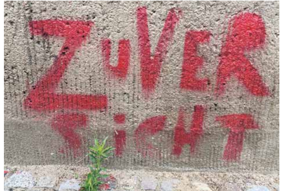
Die Zahl der Corona-Neuinfektionen nimmt ab und die warmen Monate könnten Stück für Stück für ein gewisses Maß an Normalität sorgen. Mit viel Disziplin, aber auch endlich wieder mit großer Zuversicht. Gesehen in der Spandauer Vorstadt, Berlin-Mitte

//// Kommunikation gestalten – das bedeutet, dass Entscheidungsprozesse definiert und getroffene Entscheidungen nachvollziehbar sind.