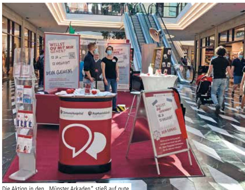
Die Aktion in den „Münster Arkaden“ stieß auf gute Resonanz bei den Besuchern

MÜNSTER. Vom 15. bis zum 17. Juli 2021 war ein Team des Clemenshospitals und der Raphaelsklinik mit einem auffälligen Messestand in den „Münster Arkaden“, einer Shopping-Mall in der Innenstadt, präsent und hat mit witzigen Slogans wie „Willst Du mit mir gehen?“ über die Arbeit in der Pflege in ihren Häusern berichtet.