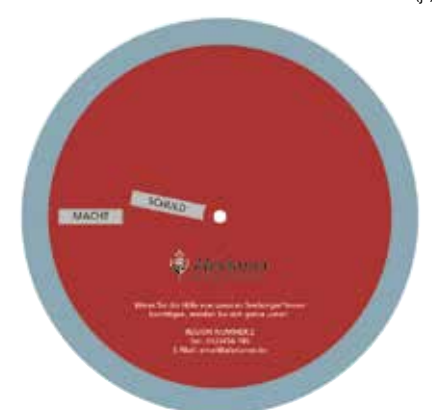
Entwurf der Drehscheibe