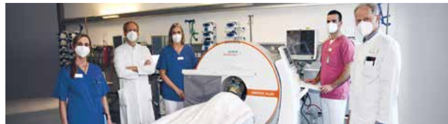
Im Klinikum Hochsauerland können schwerkranke Patienten direkt auf der Intensivstation per Kopf-CT-Bildgebung untersucht werden

auf der Intensivstation. Der mobile CT gestattet direkte und schnelle Diagnosen, ohne den Patienten aus der intensivmedizinischen Umgebung in die Radiologie und zurück transportieren zu müssen. Transportbedingte Risiken und Unannehmlichkeiten werden vermieden.