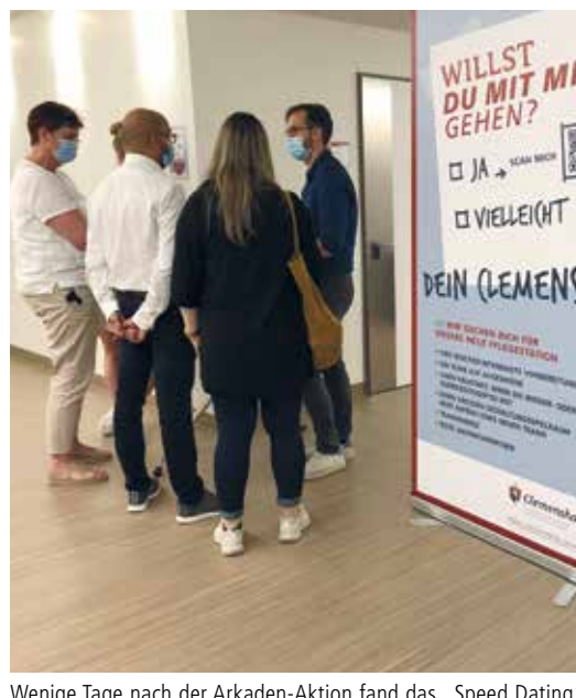
Wenige Tage nach der Arkaden-Aktion fand das „Speed Dating“ in den Kliniken statt

Wenige Tage später fanden in den Kliniken „Speed Datings“ statt, bei denen Interessierte spontan in die Kliniken kommen konnten, um sich vor Ort zu informieren.