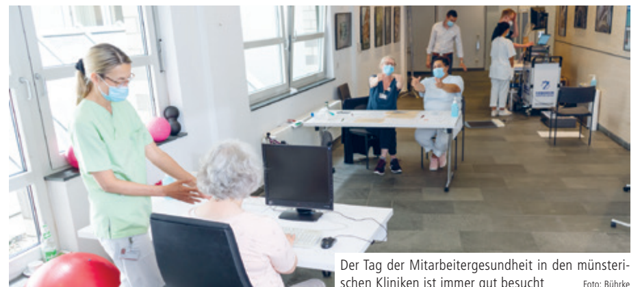
Der Tag der Mitarbeitergesundheit in den münsterischen Kliniken ist immer gut besucht