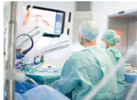
Roboterassistierte Chirurgie im Alexianer St. Hedwig-Krankenhaus

„Die mit dem Roboter mögliche Präzision führt zu besseren Ergebnissen, was zum Beispiel das Erhalten der Kontinenz angeht“, zählt Professor