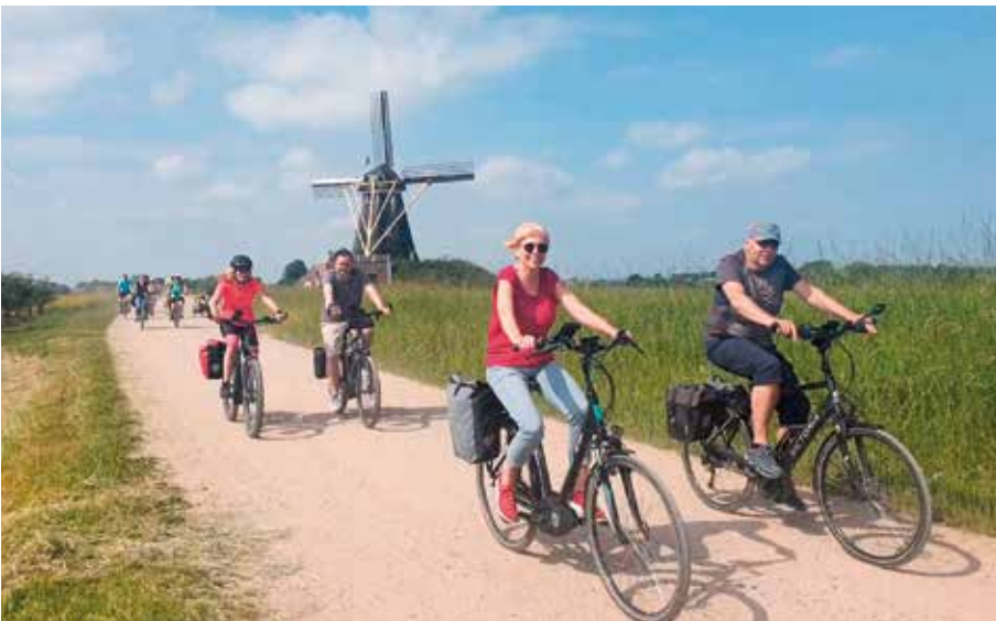
Rund 200 Kilometer fuhr die Gruppe von Gangelt nach Kevelaer und wieder zurück