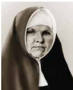
Hl. M. Katharina Kasper (1820-1898)

DERNBACH. Die seit 2020 zum Verbund der Alexianer gehörende Dernbacher Gruppe Katharina Kasper geht zurück auf eine Person: Katharina Kasper, geboren am 26. Mai 1820 in Dernbach im Westerwald. Was mit dem Bau eines ersten Hauses für die zunächst kleine Gemeinschaft um Katharina Kasper im Jahr 1847 begann, ist heute einerseits ein auf drei Kontinente verteilter Orden und andererseits ein Unternehmensverbund mit über 130 Einrichtungen in drei Bundesländern.