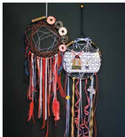
Die Traumfänger, hergestellt von Teilnehmenden aus den Kreativprojekten

Kunstobjekte, Bilder, aber auch Videoinstallationen im Schaufenster und in den Räumlichkeiten des Verkaufsateliers Kunstvoll gezeigt.