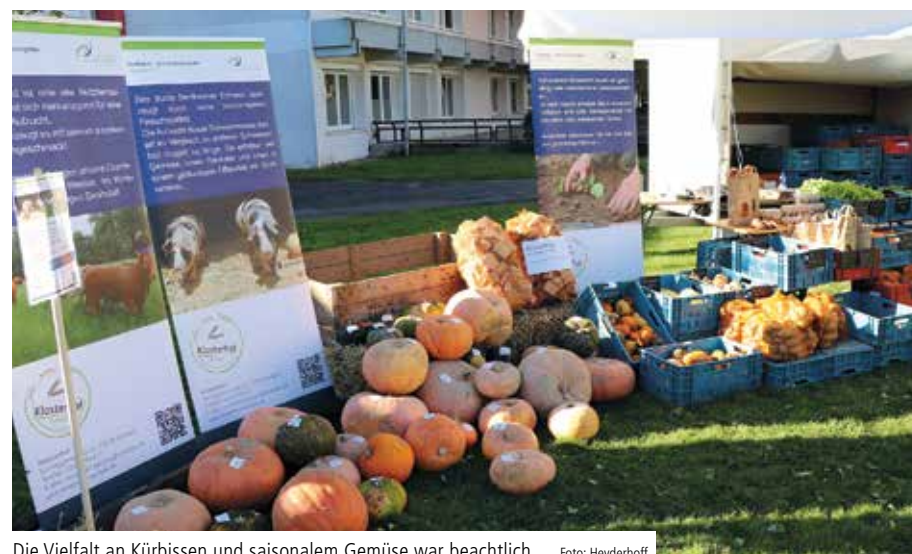
Die Vielfalt an Kürbissen und saisonalem Gemüse war beachtlich

Diese war vom Küchenteam selbstverständlich aus den Kürbissen des Klosterhofs zubereitet worden. Der Klosterhof präsentierte neben