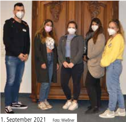
1. September 2021

Im September und Oktober 2021 konnte das Alexianer Krankenhaus Aachen zehn neue Auszubildende zur Pflegefachfrau und zum Pflegefachmann begrüßen. Herzlich willkommen! ✕