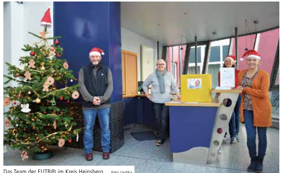
Das Team der EUTB® im Kreis Heinsberg

aufgrund eines Beschlusses des Deutschen Bundestages