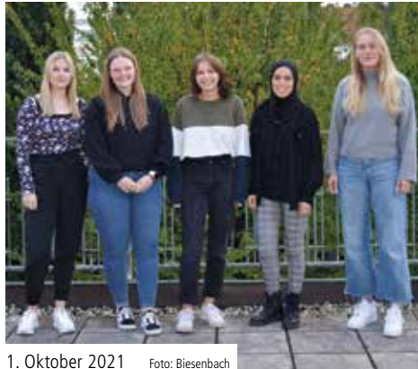
1. Oktober 2021