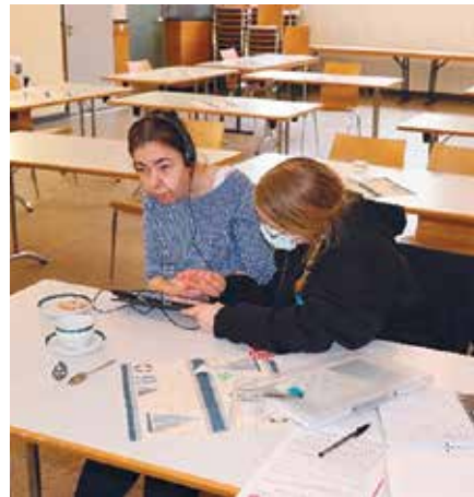
Die Teilnehmenden der Wohngruppen waren sich einig: „Ein toller Workshop, dank einem tollen Förderprogramm“

Dank des Sonderprogramms „Internet für alle“ mit einer vollumfänglichen Förderung durch die Aktion Mensch, wurde im Oktober 2021 in der ViaNobis der erste Schritt zur Erfüllung dieses Wunsches vieler Bewohnerinnen