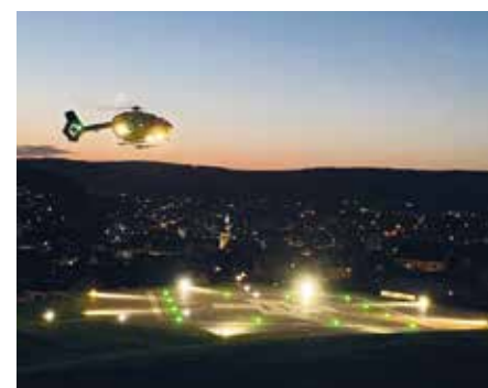
Covid-19-Patient des Universitätsklinikums Bochum auf dem Weg zum ECMO-Zentrum in Meschede. In Bochum gab es keine freien ECMO-Plätze mehr

als zertifiziertes ECMO-Zentrum ist das Haus in die überregionale Versorgung von Covid-Patienten eingebunden und hat auch beispielsweise bereits Patienten aus dem benachbarten Ausland übernommen. Die aufwendige ECMO-Therapie ist oft die letzte Behandlungsoption für die am härtesten vom Virus betroffenen Patienten. ECMO steht für extra-korporale Membranoxygenierung, sprich Sauerstoffversorgung des Blutes in einer Maschine außerhalb des Körpers, einer Art künstlicher