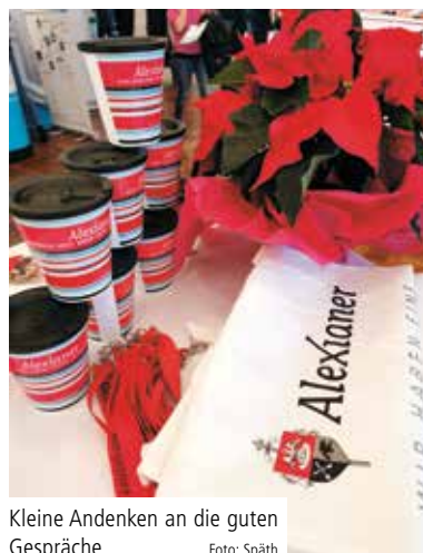
Kleine Andenken an die guten Gespräche

bekam im Anschluss an die beiden Messtage viel zu tun: Zahlreiche Bewerberinnen und Bewerber haben von der Teilnahme der Alexianer erfahren und ihre Bewerbung am Stand abgegeben. ✗ (tk)