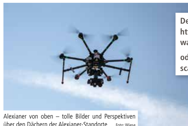
Alexianer von oben – tolle Bilder und Perspektiven über den Dächern der Alexianer-Standorte

So haben Sie die Standorte der Alexianer noch nie gesehen. Von Aachen über Krefeld nach Köln, weiter nach Berlin, Dessau und Wittenberg, zurück über Potsdam, Münster, Stolberg und Dernbach. Eine tolle Perspektive über den Alexianer-Dächern in elf Regionen, sechs Bundesländern und acht Bistümern. ✕