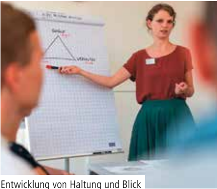
Entwicklung von Haltung und Blick über den Tellerrand

Das Erleben von Menschen mit psychischen Erkrankungen und die Entwicklung von Lebensperspektiven sind Ausgangspunkt und Ziel der Pflege in der Psychiatrie. Um ein fundiertes und spezialisiertes Wissen zum Fachgebiet der psychiatrischen Pflege zu erlangen, gibt es verschiedene Zugangswege. Einer dieser Wege ist die Fachweiterbildung Psychiatrie für Pflegekräfte, die im Jahr 1961 in Mannheim erstmals angeboten wurde.