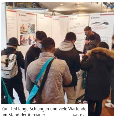
Zum Teil lange Schlangen und viele Wartende am Stand der Alexianer

Die zweitägige Messe im Palais am Funkturm war zur großen Freude aller zuvor skeptischen Aussteller sehr gut besucht. Am Stand der Alexianer wurden nahezu so viele Informations- und zum Teil Vorstellungsgespräche geführt wie selten zuvor. Auch das zentrale Bewerbungsmanagement