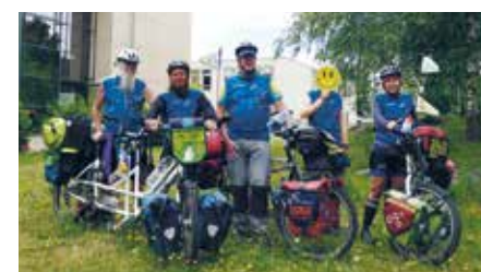
Im Juli 2022 besuchte ein Tandem-Team der „MUT-TOUR“ die Klinik Bosse in Wittenberg und das Psychosoziale Zentrum in Bitterfeld. Klientinnen und Klienten, Patientinnen und Patienten sowie Mitarbeitende tauschten sich mit den Teilnehmenden aus

WITTENBERG. Bereits zum zehnten Mal bewegten sich in diesem Sommer hunderte Menschen mit und ohne Depressionserfahrung im Rahmen der „MUT-TOUR“ durch Deutschland, um ein Zeichen zu setzen für mehr Offenheit, Wissen und Mut im Umgang mit Depressionen. x