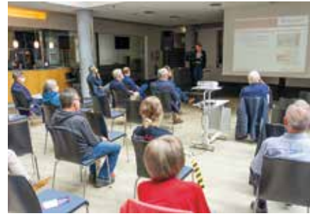
Erstmals seit Pandemiebeginn fand im Foyer der Raphaelsklinik wieder ein öffentlicher Infotag statt

konnten wir wieder eine öffentliche Informationsveranstaltung durchführen. Darüber freuen wir uns sehr, denn das persönliche Gespräch ist gerade bei solch sensiblen Themen durch nichts zu ersetzen“, sagten