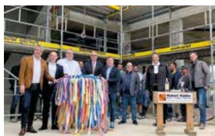
Richtfest in der neuen Zentralschule in Münster

Austausch und Kommunikation sein. Wir freuen uns sehr, wenn die neuen Räume im Sommer nächsten Jahres bezogen werden können.“