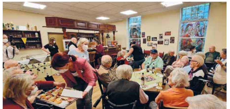
Zur Eröffnung am 5. Mai 2022 versammelten sich zahlreiche Bewohnerinnen und Bewohner des Seniorenzentrums in der neuen Kneipe „Agathe“