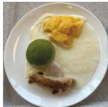
Vom Apfelpfannkuchen bis zum Rindergulasch ist alles möglich