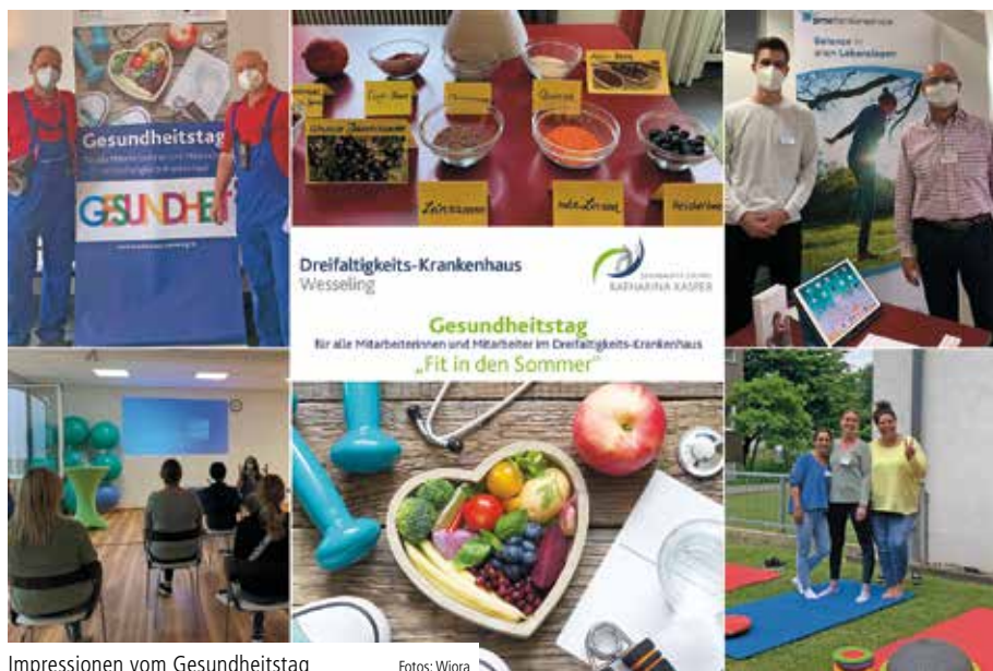
Impressionen vom Gesundheitstag

Erster Gesundheitstag am Wesseling Dreifaltigkeits-Krankenhaus