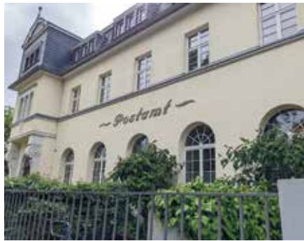
Gleich mehrere Projekte der Alexianer haben jetzt hier ihre Anlaufstelle

Bereits seine Räume übernommen hat auch das Koordinierungsbüro von „Mehr Freizeit“. Das ist ein Projekt der Alexianer Köln und der Aktion Mensch mit dem Ziel, Menschen mit