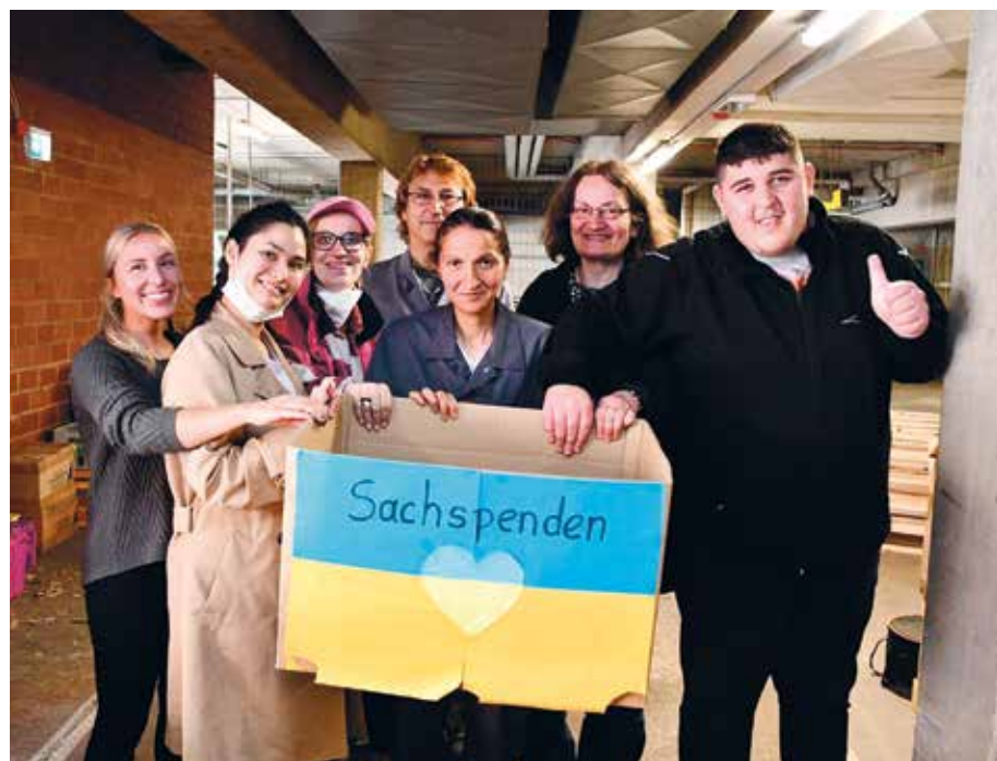
Mehrere Wochen wurden Spenden gesammelt und die Weitergabe organisiert