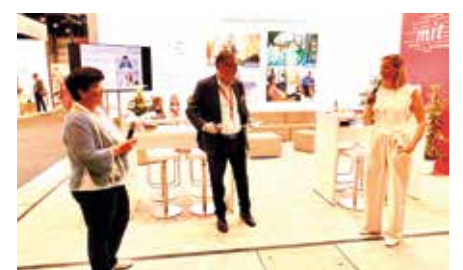
Claudia Moll (li.), Pflegebevollmächtigte der Bundesregierung beim Alexianer-Talk