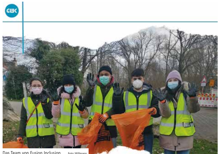
Das Team von Fusion Inclusion

mit Fusion Inclusion zeigen: Menschen mit und ohne Beeinträchtigung verfolgen die gleichen Ziele. Der Klima-