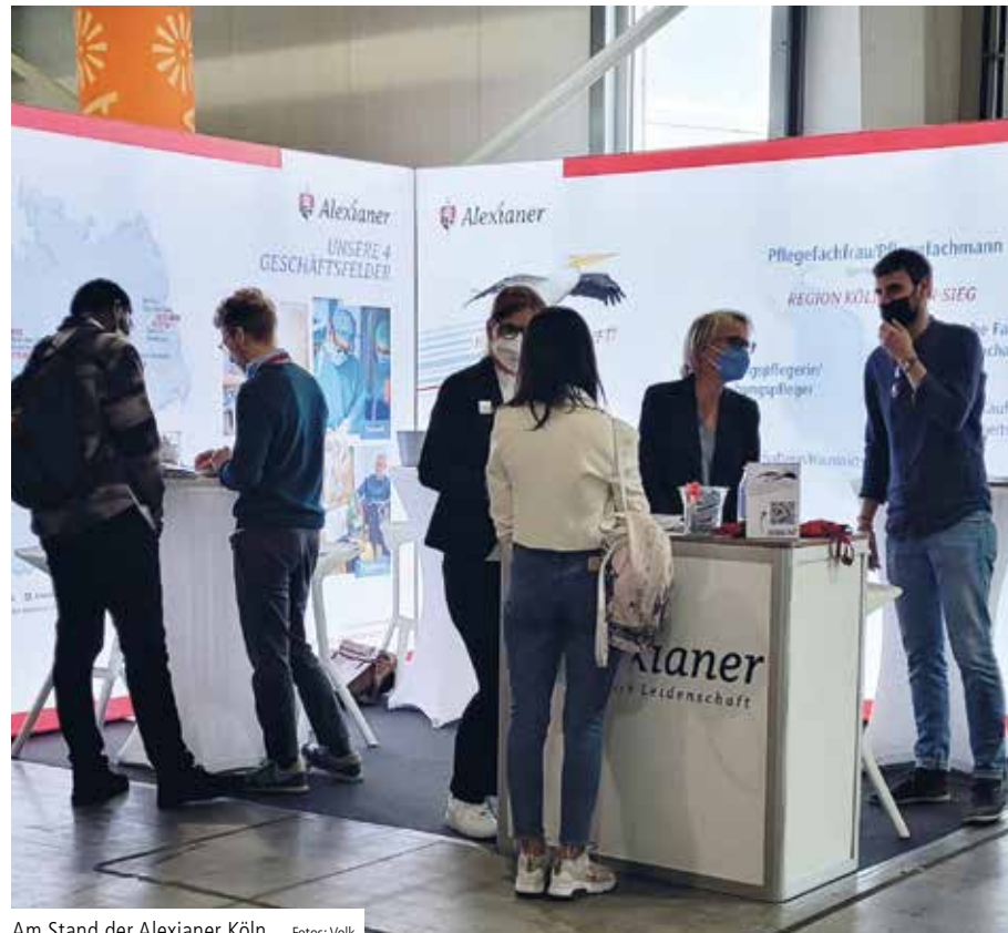
Am Stand der Alexianer Köln

Knapp 50 Interessenten waren zuvor schon als Gesprächspartner mit Interesse an einer beruflichen Zukunft bei den Alexianern Köln gemeldet worden. Auch die Gemeinnützigen Werkstätten Köln (GWK) beteiligten sich am Alexianer-Gemeinschaftsstand.