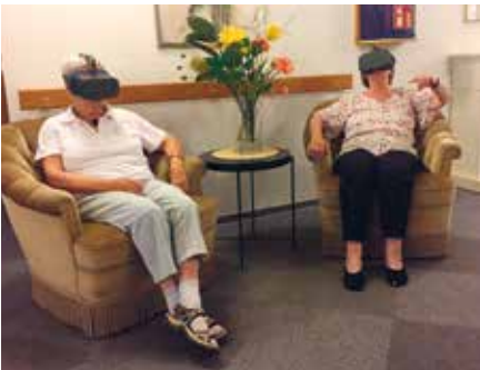
Entspannt und bequem die Welt entdecken: Die Bewohnerinnen des Seniorenhauses St. Tönis nehmen das neue Angebot begeistert an

Die Bewohner in St. Tönis erleben virtuelle Realität durch die Brille