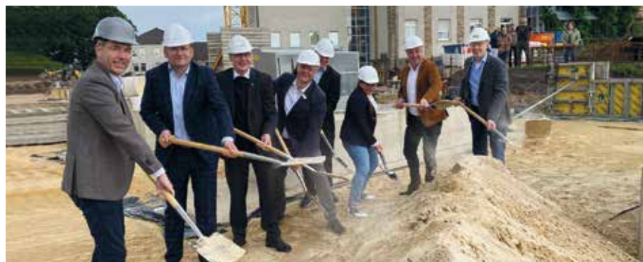
Bauherren, Mitarbeitende und Bauunternehmer beim Spatenstich

Der traditionsreiche Sandsteinbau in der Krankenhausstraße begrüßt Besucherinnen und Besucher sowie Patientinnen und Patienten zwar mit