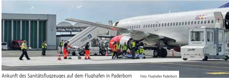
Ankunft des Sanitätsflugzeuges auf dem Flughafen in Paderborn

Verteilt nach dem sogenannten Kleeblattkonzept und koordiniert durch die Rettungsleitstellen der Kreise Paderborn und Hochsauerlandkreis wurden die Patientinnen und Patienten vom Flughafen in Paderborn mit Rettungs- und Krankentransportwagen nach Arnsberg und Meschede transportiert. Die meisten hatten schwere Verletzungen durch den russischen Angriffskrieg erlitten. Alle hatten in ihrem