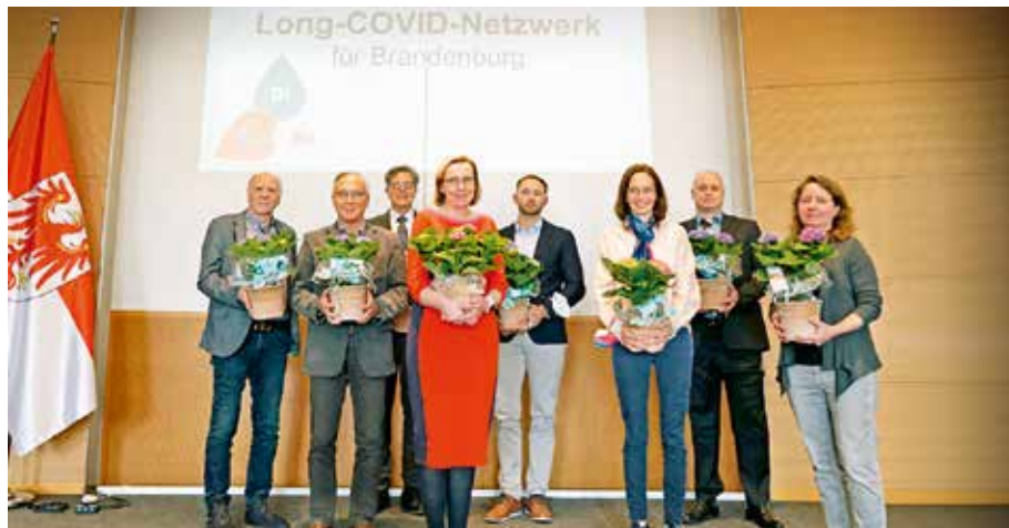
Gründungsveranstaltung in der Staatskanzlei des Landes Brandenburg in Potsdam