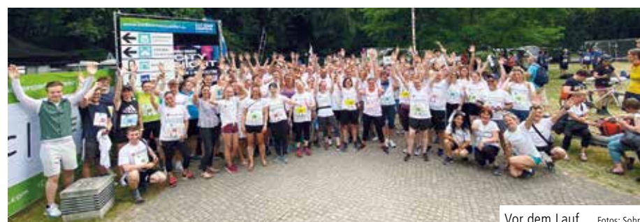
Vor dem Lauf

BERLIN. Am 17. Juni 2022 fand – nach zwei Jahren coronabedingter Zwangspause – wieder der dreitägige Teamstaffellauf im Berliner Tiergarten statt. Wie in den Jahren vor Corona zeigten sich die Mitlaufenden und Anfeuernden – bei hochsommerlichen Temperaturen – bestens aufgelegt. Und trotz der langen Unterbrechung ist den Läuferinnen und Läufern nicht die Luft ausgegangen.