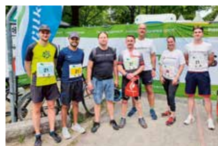
Das Team „Alexianer Akutaaufnahme“

um ihre Mitarbeiterinnen und Mitarbeiter gemeinsam in Bewegung zu bringen. Besonders sportlich zeigten sich dabei die Alexianer, die gleich mit mehreren Staffeln am Start waren.“ Insgesamt waren es 26 Teams mit je fünf Läuferinnen und Läufern aus dem St. Hedwig-Krankenhaus (SHK), Hedwigshöhe (KHH), dem St. Joseph-Krankenhaus (SJKW) sowie von Agamus und Alexianer Service GmbH. Besonderen Teamgeist bewiesen dabei diejenigen, die sich zuvor als Ersatzläuferinnen und -läufer angeboten hatten und spontan zum gemeinsamen Staffelteam „Alexianer Lauf Freunde“ zusammengefunden haben.