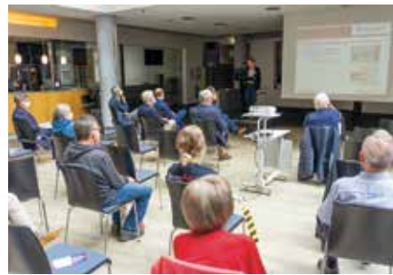
Erstmals seit Pandemiebeginn fand im Foyer der Raphaelsklinik wieder ein öffentlicher Infotag statt

konnten wir wieder eine öffentliche Informationsveranstaltung durchführen. Darüber freuen wir uns sehr, denn das persönliche Gespräch ist gerade bei solch sensiblen Themen durch nichts zu ersetzen“, sagten