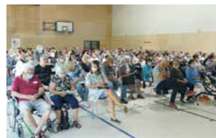
In den Vorträgen wurden 180 Besucherinnen und Besucher zu interessanten und aktuellen Themen informiert

der Gefahr von Psychosen informiert. Auch der Verein Deutsche Parkinson Vereinigung e.V., vertreten durch den Geschäftsführer und Rechtsanwalt