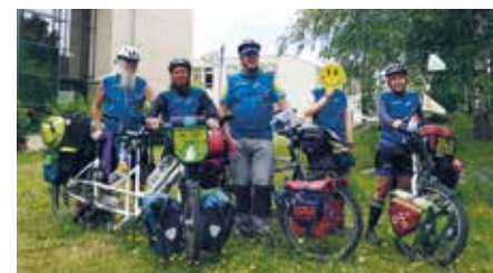
Im Juli 2022 besuchte ein Tandem-Team der „MUT-TOUR“ die Klinik Bosse in Wittenberg und das Psychosoziale Zentrum in Bitterfeld. Klientinnen und Klienten, Patientinnen und Patienten sowie Mitarbeitende tauschten sich mit den Teilnehmenden aus

WITTENBERG. Bereits zum zehnten Mal bewegten sich in diesem Sommer hunderte Menschen mit und ohne Depressionserfahrung im Rahmen der „MUT-TOUR“ durch Deutschland, um ein Zeichen zu setzen für mehr Offenheit, Wissen und Mut im Umgang mit Depressionen. x