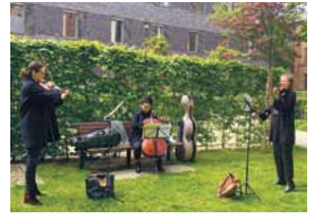
Drei Ensemblemitglieder aus dem Deutschen Sinfonieorchester wollten Musik für die Seele und Freude schenken. Sie selbst leiden in der Corona-Zeit darunter, nicht musizieren zu können. Gleich zwei Konzerte spielten sie im Patientengarten – zur Freude vieler Zuhörer