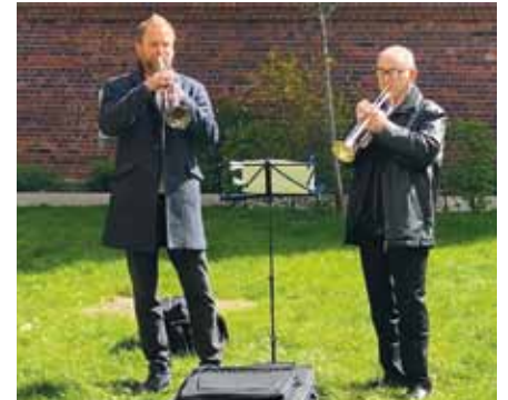
Zeichen der Solidarität in schwieriger Zeit: Trompetenkoncert des Berliner Sinfonieorchesters im St. Hedwig-Krankenhaus