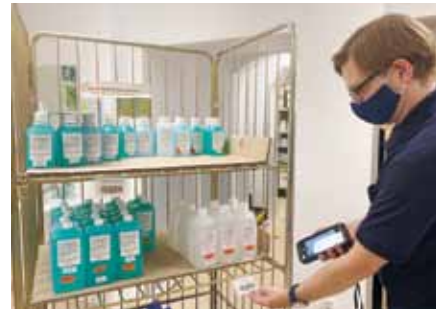
Die Apotheke hat insgesamt knapp 3.000 Liter Desinfektionsmittel in Ein-Liter- und 500-Milliliter-Flaschen für die versorgenden Krankenhäuser abgefüllt