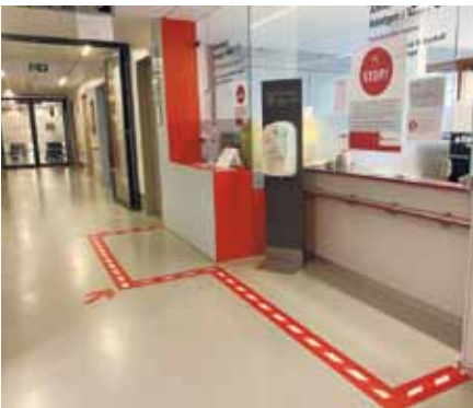
Anpassung des Wegeleitsystems in der Notaufnahme im Krankenhaus Hedwigshöhe