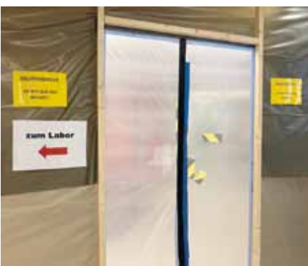
Bauliche Abgrenzung zur Corona-Ambulanz im Krankenhaus Hedwigshöhe mit dem Ziel, infektiöse von nicht infektiösen Patienten zu trennen