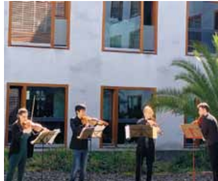
Mitglieder des Berliner Sinfonieorchesters möchten etwas Gutes tun und geben für Mitarbeiter und Patienten ein kostenloses Konzert im Krankenhaus Hedwigshöhe