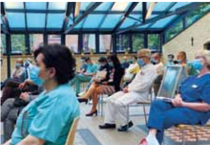
Sowohl im St. Hedwig-Krankenhaus als auch im Krankenhaus Hedwigshöhe haben im Juni 2020 Mitarbeiterversammlungen unter Einhaltung der Hygiene- und Abstandsregeln stattgefunden