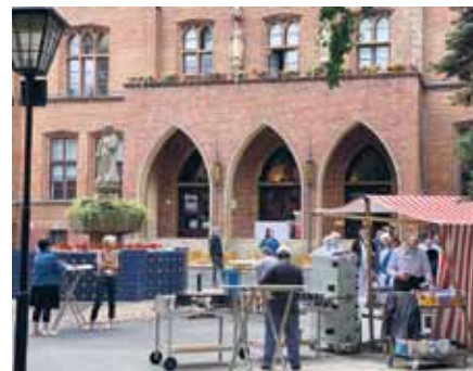
Anlässlich des Namenstages des heiligen Alexius servierte das Küchenteam der Agamus GmbH leckere selbstgegrillte Speisen auf dem historischen Innenhof und am Kesselhaus