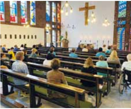
Nach vielen Wochen fand ein erster Gottesdienst zum Namenstag des heiligen Alexius im Krankenhaus Hedwigshöhe unter Beachtung der gebotenen Corona-Vorsichtsmaßnahmen statt