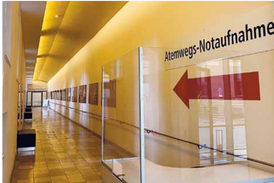
Zugang zur Atemwegsnotaufnahme im St. Hedwig-Krankenhaus. Die Einrichtung der Atemwegsnotaufnahme dient dem Schutz der Mitarbeiter und Patienten, aber auch die Arbeitsfähigkeit der St. Hedwig Kliniken soll damit sichergestellt werden