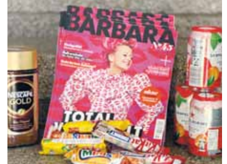
Kaffee, Süßigkeiten, Getränke und Zeitschriften. Während der Corona-Zeit erhielten die St. Hedwig Kliniken viele Sachspenden