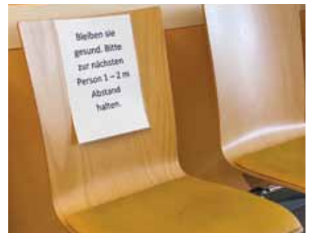
Wartebereich im Krankenhaus Hedwigshöhe für Patienten ohne Corona-Verdacht mit Hinweis zur Abstandsregel