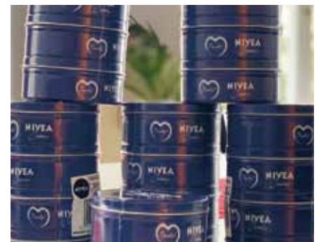
Jeder Mitarbeiter bekam im Rahmen einer Sachspende eine Dose Nivea-Creme für den privaten Gebrauch