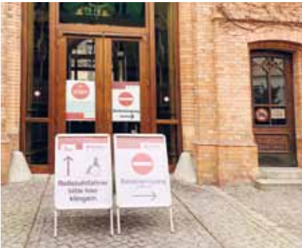
Das St. Hedwig-Krankenhaus kann nur noch über den Seiteneingang betreten werden. Alle Haupteingänge bleiben verschlossen