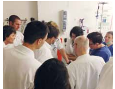
Ärztliche Schulung zur Anwendung der Beatmungsgeräte im Krankenhaus Hedwigshöhe