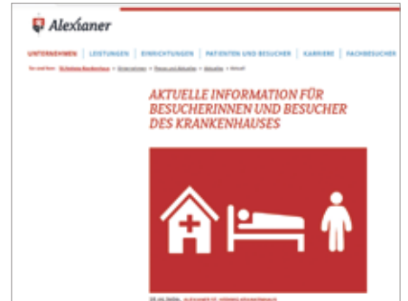
Aktuelle Besucherinformationen auf der Website der St. Hedwig Kliniken mit allgemeinen Informationen zum Corona-Virus SARS-CoV-2 und Hinweis zum verpflichtenden Tragen eines Mund-Nasen-Schutzes sowie den aktuell geltenden Besuchsregelungen