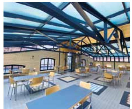
Damit der Mindestabstand gewährleistet ist, musste das Kesselhaus im St. Hedwig-Krankenhaus die Sitzmöglichkeiten reduzieren. Der Zutritt ist nur noch Mitarbeitern mit Mund-Nasen-Schutz unter Einhaltung der Abstandsregeln gestattet