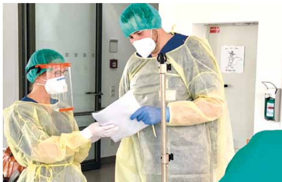
In Potsdam ist keine Entspannung in Sicht