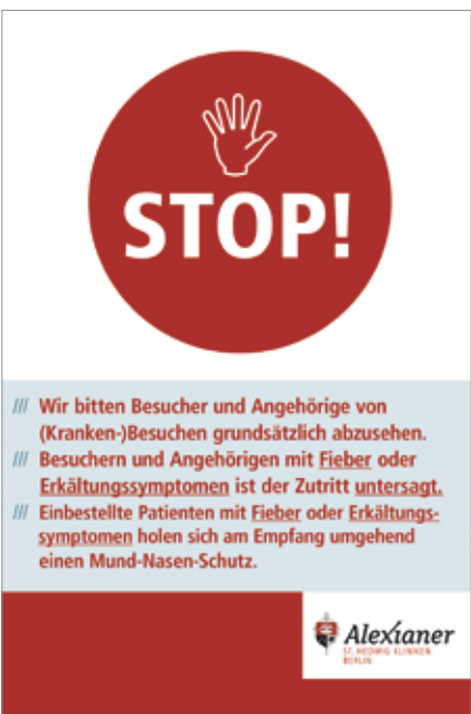
Besucher und Angehörige werden auf Plakaten über die jeweils geltenden Besucherregelungen informiert