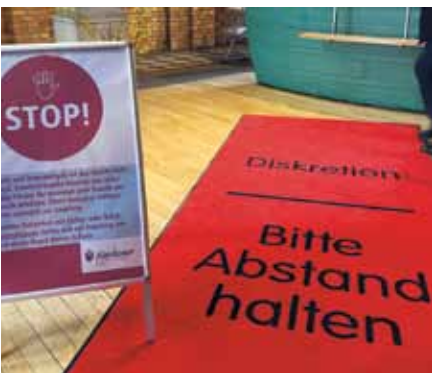
Hinweis zur Abstandsregel am Empfangsbereich im St. Hedwig-Krankenhaus und STOP-Schild mit Informationen zum Besuchsverbot sowie der Aufforderung, beim Betreten des Krankenhausgeländes einen Mund-Nasen-Schutz anzulegen