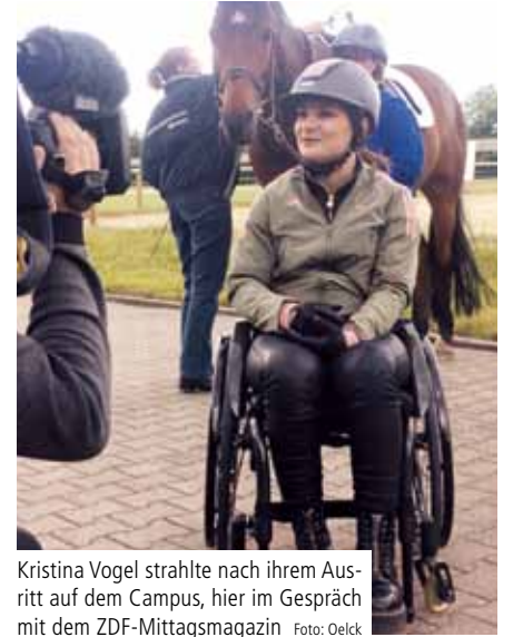
Kristina Vogel strahlte nach ihrem Ausritt auf dem Campus, hier im Gespräch mit dem ZDF-Mittagsmagazin

Eine große Herausforderung für Kristina Vogel, die ihre Beine nicht spüren kann. Nach drei Runden in der Reithalle ging es über den gesamten Campus und die 29-jährige Bahnradsportlerin fühlte sich zunehmend sicherer auf ihrem vierbeinigen Kameraden. „Ich glaube, ich könnte das öfter machen“, signalisierte die glückliche Kristina Vogel am Ende des Tages. ✕ (poe)