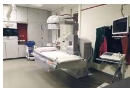
Ergometrisch höhenverstellbarer Durchleuchtungsarbeitsplatz

Mitte des vergangenen Jahres hatte die Alexianer Agamus GmbH den Auftrag erhalten, die digitale Röntgenanlage im St. Hedwig-Krankenhaus zu erneuern. Diese Maßnahme wurde notwendig, da das vorhandene Röntgensystem der digitalen Durchleuchtung veraltet war und vom Hersteller servicetechnisch nicht mehr betreut wurde.