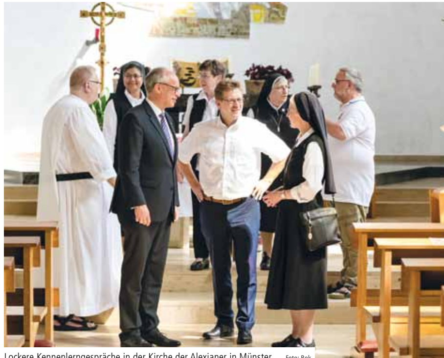
Lockere Kennenlerngespräche in der Kirche der Alexianer in Münster

Ausrichtung hervorragend zusammen. Wir freuen uns auf die neuen Koll-ginnen und Kollegen und heißen sie