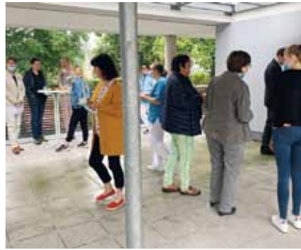
Im Anschluss an den Hausgemeinschaftsgottesdienst trafen sich die Mitarbeiter zu einem gemeinsamen Kaffeetrinken