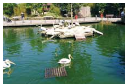
Pelikangehege im Münsteraner Allwetterzoo

Damit zeigen die Alexianer auf besondere Weise ihre Verbundenheit zum Allwetterzoo und unterstützen mit einem kleinen Beitrag die dortige Arbeit. Und dass insbesondere in Zeiten, in denen auch der Zoo schließen musste beziehungsweise nur eine maximale Besucherzahl zugelassen ist. Die Pelikan-Patenschaft ist