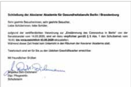
Schließung der Alexianer Akademie am 16. März 2020. Seit dem 11. Mai 2020 können maximal zwei Klassen gleichzeitig anwesend sein. Alle anderen Schüler befinden sich in der Praxis oder im Homeschooling. Seit dem 10. August 2020 läuft der Regelbetrieb wieder