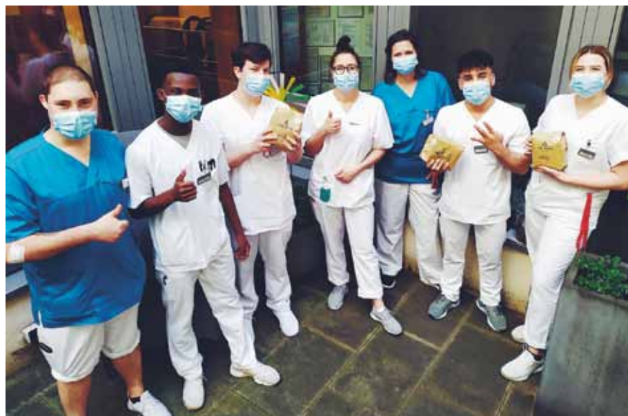
Freude über eine großzügige Kaffeespende von der Firma The Barn Coffee Roasters