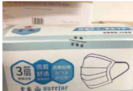
Es bestanden fortlaufende Lieferengpässe von Desinfektionsmitteln, Mund-Nasen-Schutz-Masken (MNS), FFP-Masken und Schutzkleidung. Die Pflegedirektionen koordinierten die Ausgabe