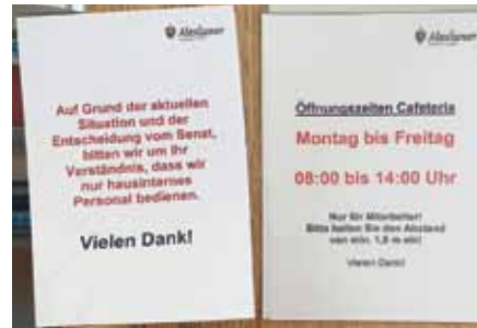
Die Cafeterien haben eingeschränkte Öffnungszeiten und sind nur noch für Mitarbeiter der St. Hedwig Kliniken geöffnet. Gäste haben keinen Zutritt. Damit soll die Ausbreitung des Corona-Virus verhindert werden