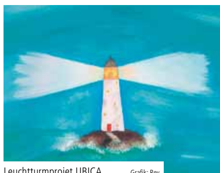
Leuchtturmprojekt UBICA Grafik: Rey

„Am Ende unseres Pastoralen Prozesses werden wir feststellen, dass sich viel bewegt hat. Die Beteiligten haben miteinander viel erlebt. Niemand ist unberührt und unverändert geblieben. Wir haben – um im biblischen Bild zu bleiben – uns befreit, können nun (wieder) aufrecht gehen, sind stärker geworden, haben uns kennen und schätzen gelernt. Wir haben eine Perspektive gefunden und neue Ideen entwickelt, weil wir uns auf SEIN Wort, Jesu Wort verlassen haben.“ (Pastoralkonzept St. Josef Treptow-Köpenick) ✕ (stm)