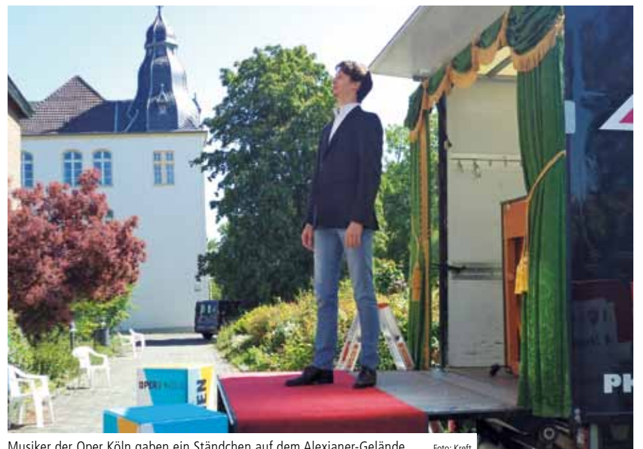
Musiker der Oper Köln gaben ein Ständchen auf dem Alexianer-Gelände

Der Sohn eines Bewohners hatte den passenden Tipp gegeben. Er wies auf eine Aktion der Telekom hin, in deren Rahmen Pflegeeinrichtungen drei Handys zum symbolischen Preis von jeweils einem Euro bestellen konnten, mit kostenlosem Tarif und zehn Giga-