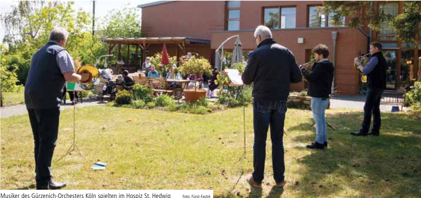
Musiker des Gürzenich-Orchesters Köln spielten im Hospiz St. Hedwig