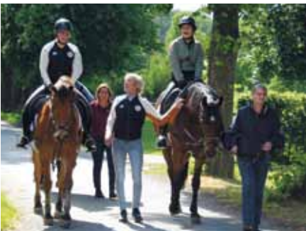
Einmal über den gesamten Alexianer-Campus – Kristina Vogel genoss ihren Ausritt auf „Bernd“

Querschnittsgelähmte Olympiasiegerin Kristina Vogel zu Gast im Alexianer-Reittherapiezentrum