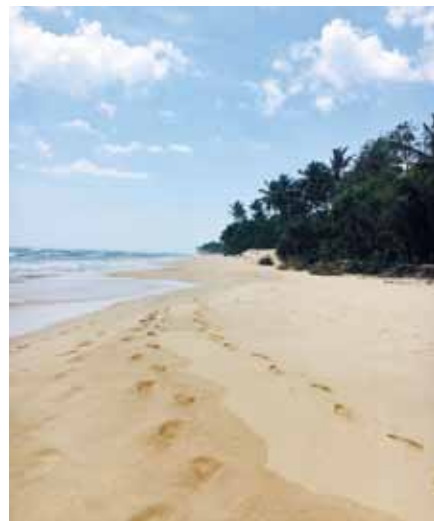
Kilometerlange, leere Sandstrände sind auf Sri Lanka zu entdecken