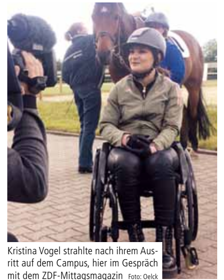
Kristina Vogel strahlte nach ihrem Ausritt auf dem Campus, hier im Gespräch mit dem ZDF-Mittagsmagazin

Eine große Herausforderung für Kristina Vogel, die ihre Beine nicht spüren kann. Nach drei Runden in der Reithalle ging es über den gesamten Campus und die 29-jährige Bahnradfahrerin fühlte sich zunehmend sicherer auf ihrem vierbeinigen Kameraden. „Ich glaube, ich könnte das öfter machen“, signalisierte die glückliche Kristina Vogel am Ende des Tages. ✕ (poe)