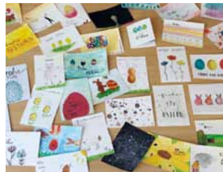
Pfiffige Osterhasen, bunte Ostereier und weitere fröhliche Motive erreichten die Bewohner des St. Gertrudenstifts in Greven

So viele Postkarten gestalteten und verschickten die Patienten der Don Bosco Klinik an Bewohner des St. Gertrudenstifts.