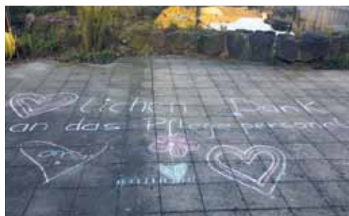
... und ein Dankeschön an das Personal gab es in Wolbeck

„Wir haben Dich lieb, Oma!“ und „Danke an das Pflegepersonal!“ – über solche Grüße freuten sich Mitarbeiter und Bewohner des Achatius-Hauses in Münster-Wolbeck im März 2020. Aufgrund der SARS-CoV-2-Pandemie (Corona-Krise) galt auch in dieser Alexianer-Pflegeeinrichtung ein Betretungsverbot. Doch Not macht bekanntlich er-