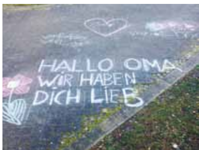
Grüße für die Oma ...

Angehörige schicken während der Corona-Krise Grüße via Straßenkreide