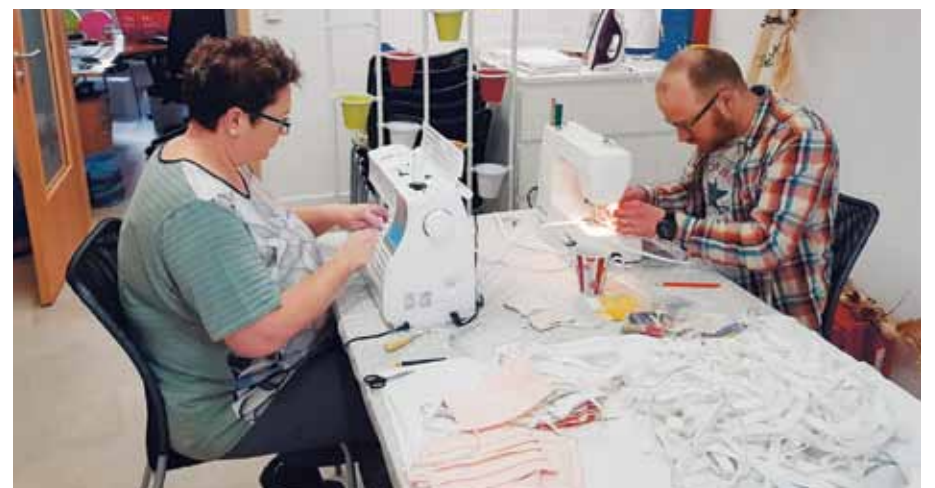
Aus der heißen Nähphase ist bei mancher Kollegin die Begeisterung für das Nähen entstanden

Die Kollegen und Kolleginnen, deren Leistungsbereiche durch die gesetzlichen Regelungen geschlossen waren, blieben jedoch nicht untätig. Schnell wurden die privaten Nähmaschinen entstaubt und in Teamarbeit entstanden im Zeitraum von März bis Mai 2020 an allen Standorten der Alexianer Ambulanten Dienste in Summe circa 1.000 textile Gesichtsmasken. Die im Internet recherchierten Schnitte wurden ausprobiert und verfeinert. Privat gespendete Stoffe – von Tischdecken