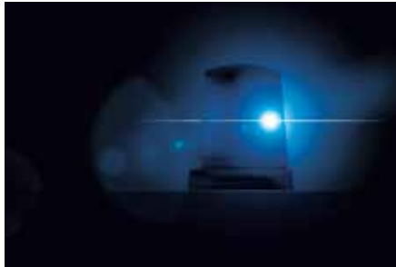
Im Notfall zählt jede Sekunde