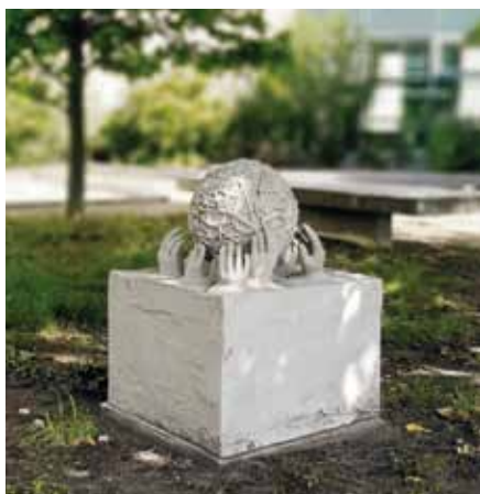
Die Kugel stellt die Klinik dar. Die Hände symbolisieren die Patienten, die einerseits sehr nah mit der Klinik verbunden sind und sich andererseits von der Klinik entfernen

Der Besuch der Clownienen vom Verein Clownsamen e.V. Taucha bildete den Startschuss für insgesamt zehn Spieltermine. Da die Clownsbesuche keine Krankenkassenleistung sind, werden sie ausschließlich über Spendengelder des Vereins St. Joseph hilft finanziert.