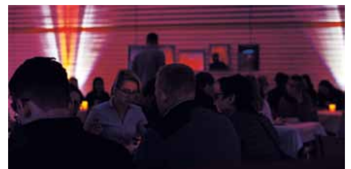
Der kulinarische Genuss kam nicht zu kurz