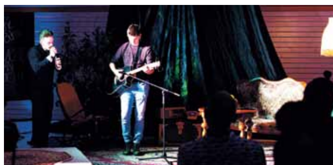
Die Leipziger Band „Ungefiltert“ ließ rockige Klänge ertönen