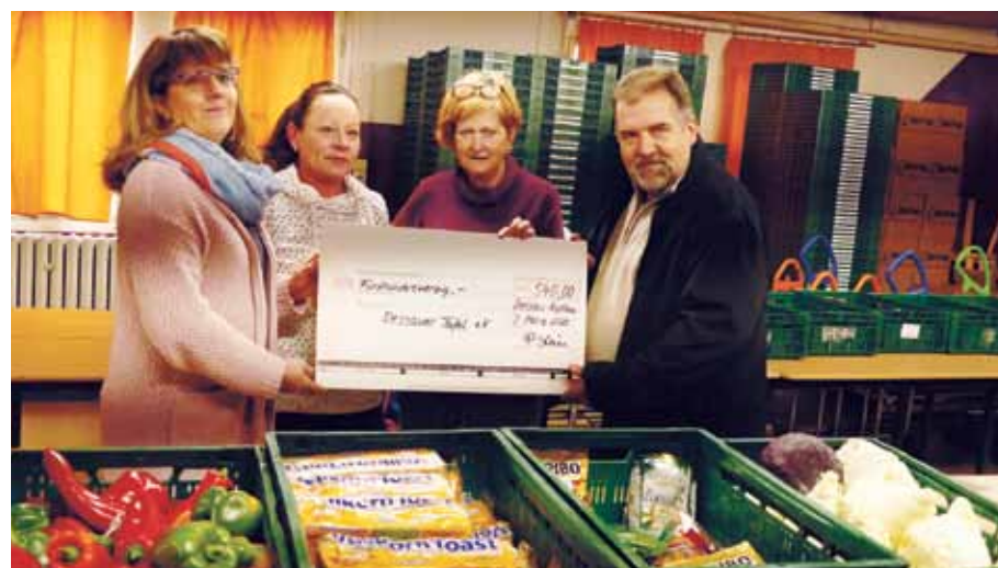
Die Dessauer Tafel verteilt Essen an bedürftige Menschen. Mit dem gespendeten Geld soll eines ihrer Fahrzeuge repariert werden