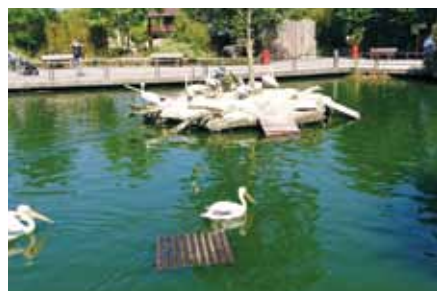
Pelikangehege im Münsteraner Allwetterzoo

Damit zeigen die Alexianer auf besondere Weise ihre Verbundenheit zum Allwetterzoo und unterstützen mit einem kleinen Beitrag die dortige Arbeit. Und dass insbesondere in Zeiten, in denen auch der Zoo schließen musste beziehungsweise nur eine maximale Besucherzahl zugelassen ist. Die Pelikan-Patenschaft ist