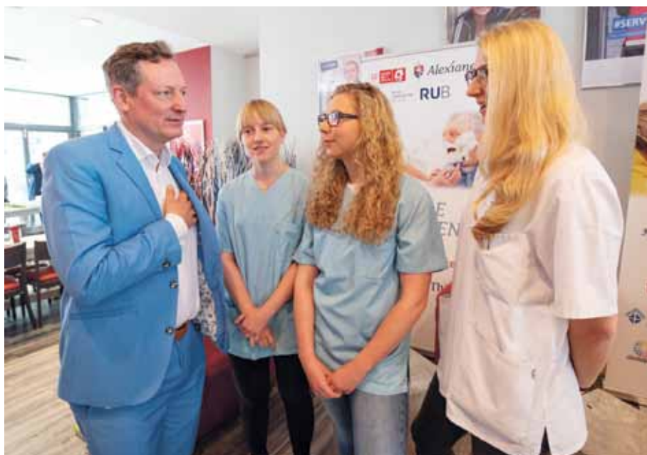
Mit Freude pflegen – für Eckart von Hirschhausen ein besonderes Anliegen

MÜNSTER. Mit „Freude pflegen“ – das innovative Unterrichtskonzept zum Stressmanagement und zur langfristigen Erhaltung der Motivation für Pflegeauszubildende – wird derzeit in einer Langzeitstudie von Eckart von Hirschhausens Stiftung „HUMOR HILFT HEILEN“, der Ruhr-Universität Bochum und von den Alexianern wissenschaftlich untersucht. Nach einer ersten halbjährigen Erprobungsphase können bereits vielversprechende Ergebnisse aufgezeigt werden.