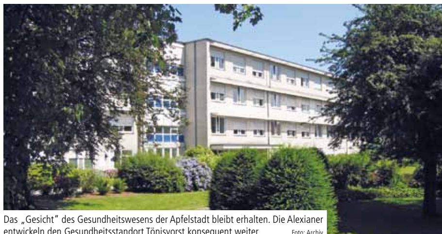
Das „Gesicht“ des Gesundheitswesens der Apfelstadt bleibt erhalten. Die Alexianer entwickeln den Gesundheitsstandort Tönisvorst konsequent weiter.

Alexianer bleiben der Apfelstadt treu und entwickeln Gesundheitsstandort weiter