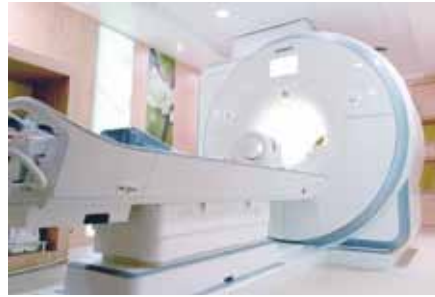
Neue MRT-Geräte in den St. Hedwig Kliniken

Dabei wurden alle technischen Komponenten – bis auf den Magneten – ausgetauscht und auf den neuesten Stand gebracht. Neben der hochauflösenden, präzisen Diagnostik verkürzen sich auch die Untersuchungszeiten.