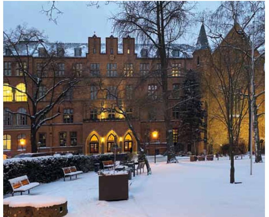
Schnee, Eis und heftiger Wind haben in vielen Regionen Deutschlands für Chaos gesorgt. Aber das Winterwetter hatte auch seine schönen Seiten, wie hier am Alexianer St. Hedwig-Krankenhaus in Berlin-Mitte

eine langfristige wirtschaftliche Stabilität und Nachhaltigkeit verleihen, sodass wir uns mit viel Rückenwind durch diese anhaltende Pandemie bewegen können.