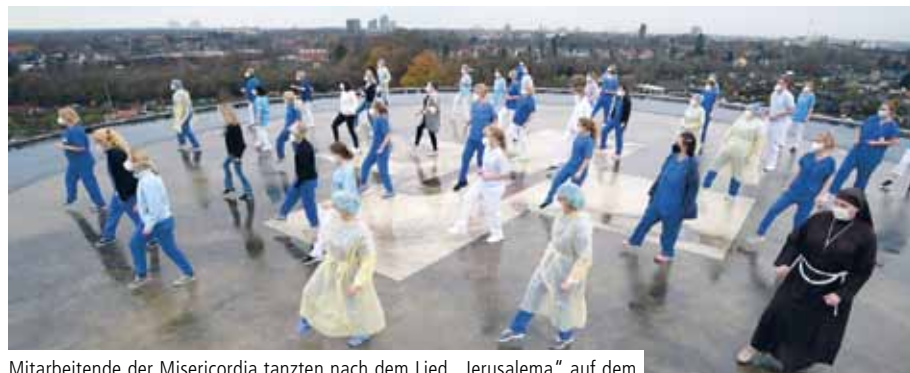
Mitarbeitende der Misericordia tanzten nach dem Lied „Jerusalema“ auf dem Hubschrauberlandeplatz des Clemenshospitals

Alexianer-Mitarbeiter tanzen gegen den Corona-Frust