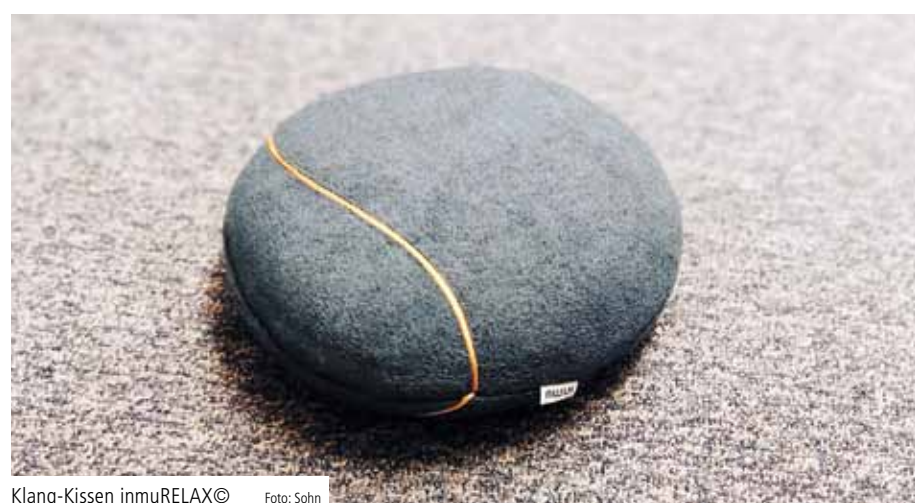
Klang-Kissen inmuRELAX©

Inzwischen hat sich gezeigt, dass Patienten mit Demenz dieses Kissen gerne verwenden. Es unterstützt sie, vom stressigen Krankenhausalltag