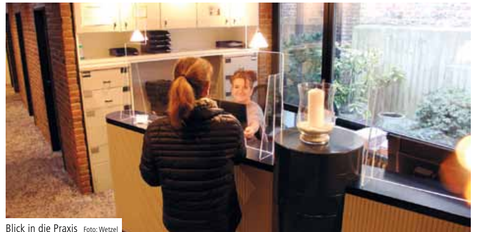
Blick in die Praxis