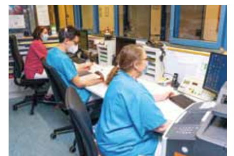
Das Team der Station 3A bei der Arbeit

Eine Sekretärin und eine Stationshilfe komplettieren das Team der 3A. Die chirurgischen Stationen sind auf diese Weise entlastet, das Team kann sich morgens besser um die zum Teil frisch operierten Patienten kümmern. Ein weiterer Vorteil für das Team