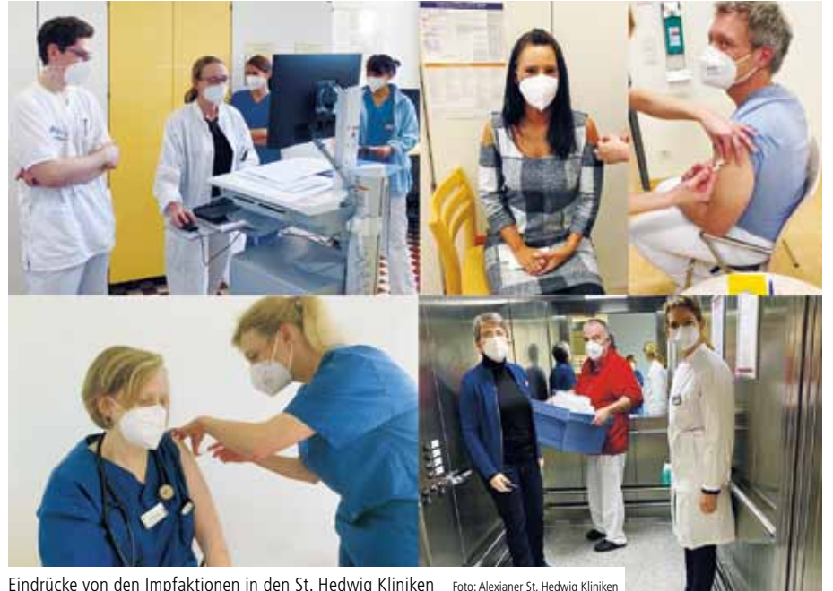
Eindrücke von den Impfaktionen in den St. Hedwig Kliniken

Deshalb war es auch nicht verwunderlich, dass kaum jemand eine angebotene Covid-Impfung ablehnte. Geimpft wurden alle Berufsgruppen dieser Bereiche, seien es Pflegenden, Ärztinnen und Ärzte, Servicemitarbeiter oder Angehörige der therapeutischen Dienste.