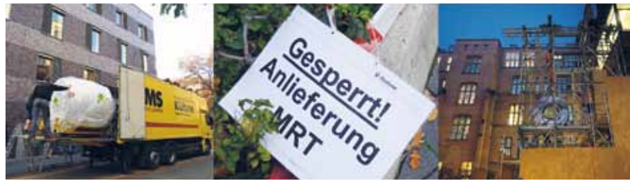
Eindrücke vom MRT-Einbau im St. Hedwig-Krankenhaus

„Mit den neuen MRTs verfügen beide Häuser nun über modernste