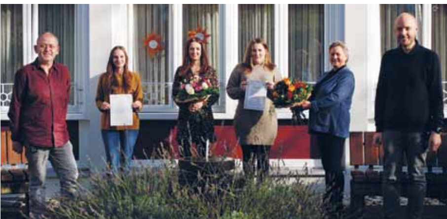
Das Team aus dem Ignatius-Lötschert-Haus freut sich über die erfolgreiche Rezertifizierung

Wohnbereiche des Ignatius-Lötschert-Hauses in Horbach erzielen bei Böhm-Rezertifizierung erneut Bestnoten