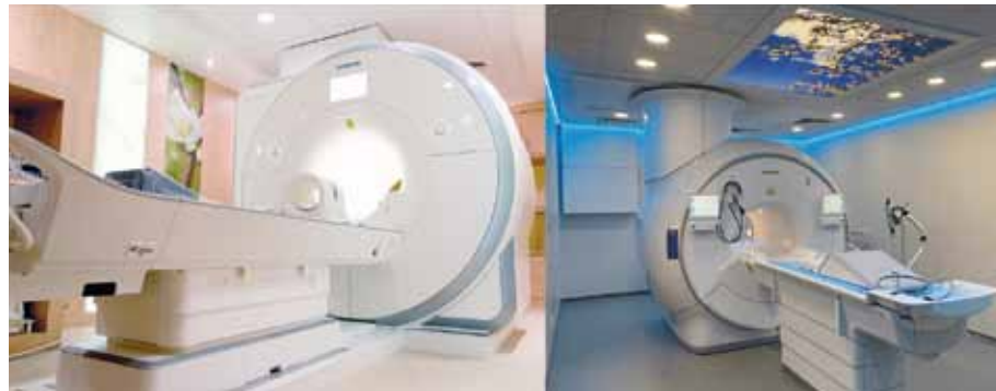
Neue MRT-Geräte im Krankenhaus Hedwigshöhe (li.) und St. Hedwig-Krankenhaus (re.)