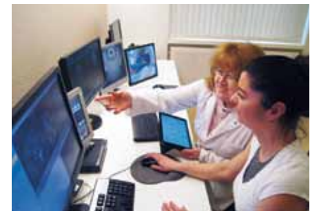
Volldigitalisierte MRT-/CT-Praxis am Alexianer St. Joseph-Krankenhaus Berlin-Weißensee

Ähnlich anwenderfreundlich funktioniert das Patientenportal MyVue, über das Patienten eine Zugriffsmöglichkeit auf ihre radiologischen Bilder haben. So kann der Patient seine Bilddaten selbst verwalten, sie bei Bedarf abspeichern oder verschiedenen Ärzten den Zugriff ermöglichen, beispielsweise für eine