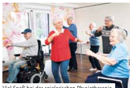
Viel Spaß bei der spielerischen Physiotherapie

Die MemoreBox ist eine Videospieleplattform, die über Gesten verschiedene computerbasierte Trainingsprogramme lebensnah steuern kann. Eine Spezialkamera nimmt die Körperbewegungen auf und überträgt diese in das Programm auf das TV-Gerät. So können Senioren nach Anschluss an den handelsüblichen Fernseher zum Beispiel Kegeln oder Motorradfahren. Beim virtuellen „Kegeln“ ist beispielsweise nur eine leichte Arm-