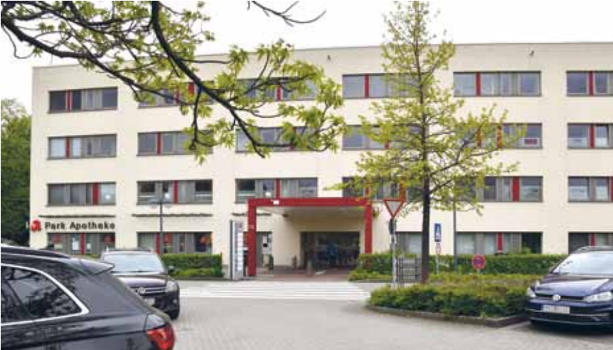
Das Facharztzentrum Krefeld ist ein wichtiger Anlaufpunkt für Patienten aus Krefeld und Umgebung, die fachärztliche ambulante Versorgung benötigen. Das Haus beinhaltet auch eine leistungsstarke Apotheke, eine Logopädie-Praxis und ein Hör-Akustik-Geschäft

Seit zehn Jahren besteht das Facharztzentrum FAZ-Krefeld