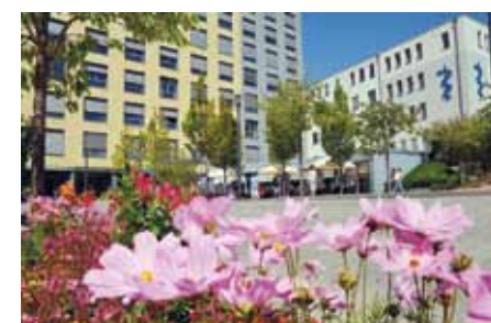
Bethlehem Gesundheitszentrum Stolberg gGmbH – nun Hand in Hand mit den Alexianern

des Luisenhospitals in Aachen oder eben in Stolberg absolvieren. Über die Aachener GmbH betreiben die Alexianer außerdem einige andere Einrichtungen in Stolberg, sodass man sich auch aus der unmittelbaren Nachbarschaft mit zahlreichen Berührungspunkten kennt. „Die Region Aachen ist für uns interessant, hier haben wir mit dem Alexianer Krankenhaus Aachen, der Fachklinik für Psychiatrie, unser Mutterhaus. Wir freuen uns, dass wir mit der Über-