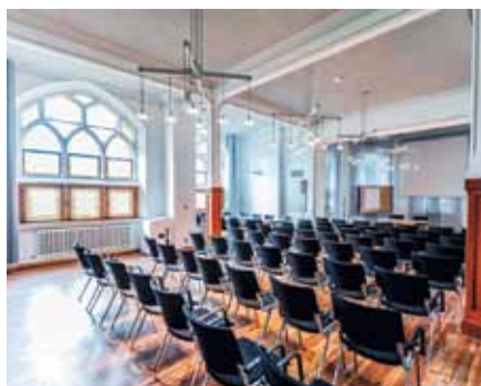
Historischer Seminarraum Katharina Kasper

Firmenkunden profitieren von den Beratungsleistungen der DGKK Dienstleistung GmbH sowie von der Mög-