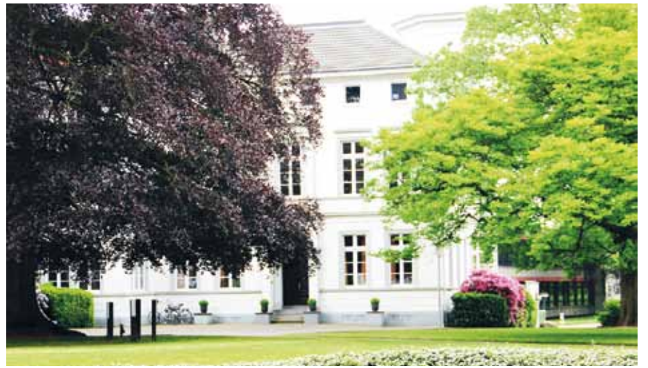
Die Liebfrauenschule Mülhausen: gegründet 1888 von den Schwestern Unserer Lieben Frau