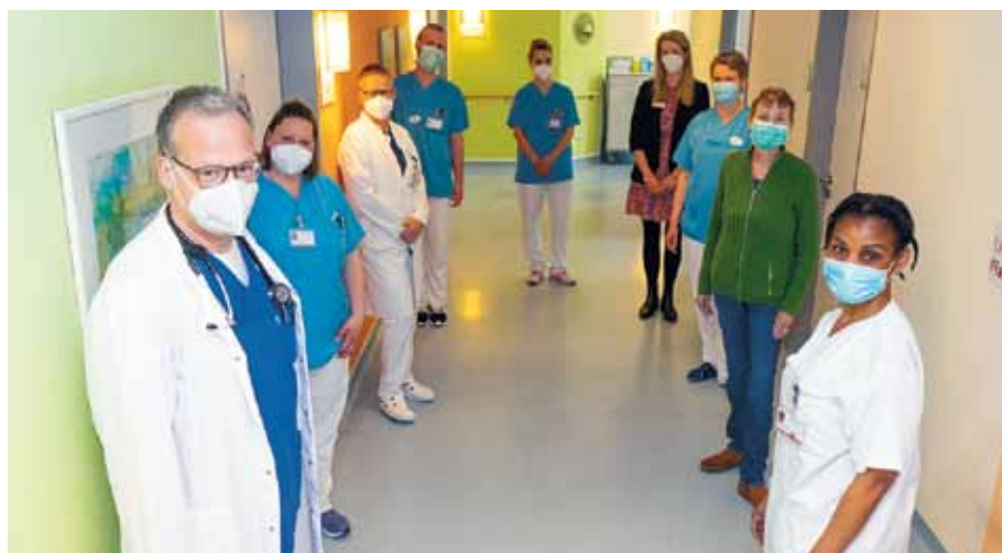
Auf der Palliativstation der Raphaelsklinik arbeiten Pflege, Medizin, Therapie und externe Organisationen Hand in Hand

MÜNSTER. Im April 2011 wurde die Versorgung von Palliativpatienten der Raphaelsklinik mit zunächst vier Betten aufgenommen. Heute verfügt die eigenständige Palliativstation über elf Betten und versorgt über 300 Patienten pro Jahr. Die Experten der Raphaelsklinik betonen, dass das Bild einer Endstation im Zusammenhang mit der Palliativstation falsch sei, vielmehr gehe es