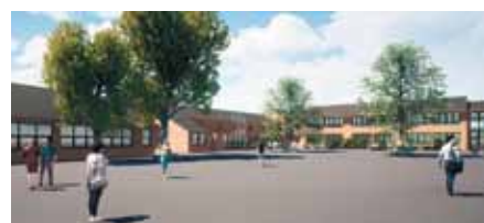
Ausblick auf das neue Schulgebäude nach Fertigstellung

ARNBERG. Mit vielfältigen Investitionen in eine gute eigene Ausbildung will das Klinikum Hochsauerland dem steigenden Fachkräftebedarf in der Pflege begegnen und hat hierzu bereits zusätzliche Ausbildungsplätze geschaffen. 113 Berufsstarter haben 2020 eine Pflegeausbildung im Klinikum Hochsauerland begonnen.