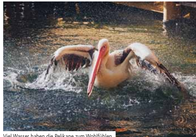
Viel Wasser haben die Pelikane zum Wohlfühlen. Da freuen sich auch deren Paten, die Alexianer

Reiher den Dreh heraus, wie sie in das Haus schwimmen können, obwohl Reiher eigentlich Nichtschwimmer sind.