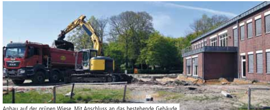
Anbau auf der grünen Wiese. Mit Anschluss an das bestehende Gebäude entstehen neue Räumlichkeiten für die Pflegeausbildung