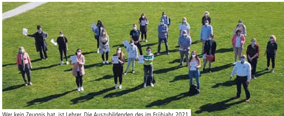
Wer kein Zeugnis hat, ist Lehrer. Die Auszubildenden des im Frühjahr 2021 examierten Jahrgangs sind stolz auf das Erreichte

Die Alexianer Akademie für Pflege Krefeld baut ihre Ausbildungskapazitäten massiv aus