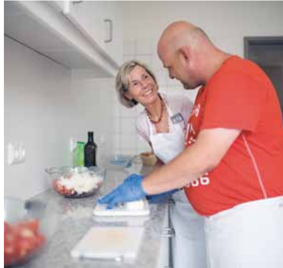
Beim 17. Deutschen Reha-Tag ging es um Dimensionen von Teilhabe psychisch kranker Menschen

„Umso wichtiger ist es, Möglichkeiten aufzuzeigen, wie eine Rehabilitation zu einer umfassenden Teilhabe beitragen kann. Eine frühe Diagnose und eine entsprechende Therapie können den Patienten dabei helfen, möglichst aktiv wieder am Leben teilzunehmen. Inzwischen gibt es zahlreiche und unterschiedliche Therapie-