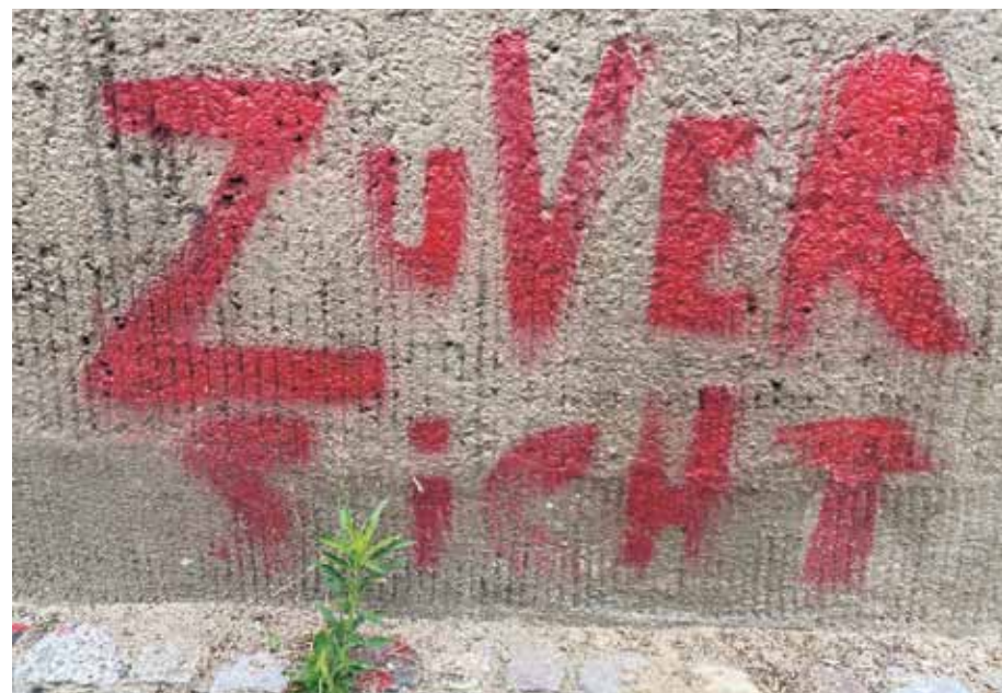
Die Zahl der Corona-Neuinfektionen nimmt ab und die warmen Monate könnten Stück für Stück für ein gewisses Maß an Normalität sorgen. Mit viel Disziplin, aber auch endlich wieder mit großer Zuversicht. Gesehen in der Spandauer Vorstadt, Berlin-Mitte

//// Kommunikation gestalten – das bedeutet, dass Entscheidungsprozesse definiert und getroffene Entscheidungen nachvollziehbar sind.