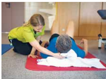
Rehabilitation ist professionelle Unterstützung für den Wiedereinstieg in den Alltag.

„Hochmotiviertes Team mit hoher Veränderungsbereitschaft und großem Engagement.“ „Große Mitarbeiterstabilität, intensive Einbeziehung von externem Dienstleister in der Physiotherapie.“ „Bezugstherapeutesystem sichert die Kontinuität in der Betreuung.“ „Organisation und Durchführung eines digitalen Rehatages.“