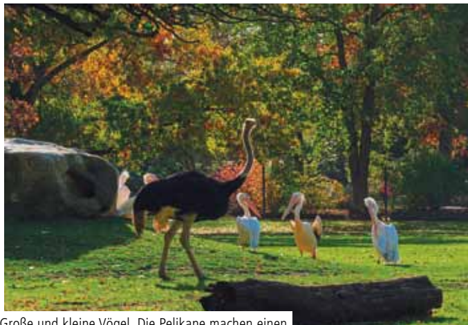
Große und kleine Vögel. Die Pelikane machen einen Erkundungsausflug in die Savanne.

Wie im Freiland gibt es zwischen den Tierarten Interaktionen und eine stille Rangordnung. Die heimlichen Herrscher der Savanne sind die Spießböcke. Einzig die heimischen Graureiher bleiben aufdringlich. Ursprünglich hofften die Zoomitarbeiter, den Fischeschmarotzern mit der neuen Anlage das Leben etwas schwerer zu machen, denn am alten Wohnort der Pelikane waren sie für die Zoobewohner eine echte Plage. Sie schnappten den Pelikanen bei der Fütterung den Fisch sogar aus den Kehlsäcken heraus. In der Pelikan-Lagune findet daher die Fütterung nur innen statt. Trotzdem haben schon jetzt einige