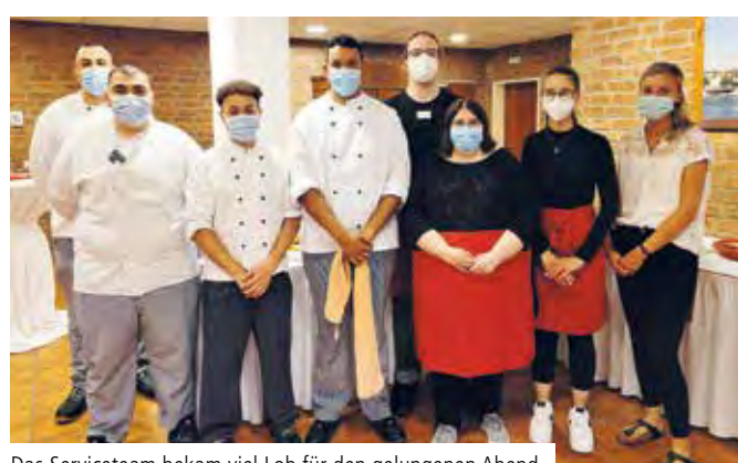
Das Serviceteam bekam viel Lob für den gelungenen Abend