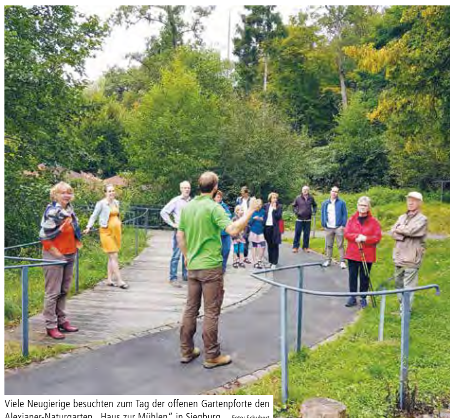
Viele Neugierige besuchten zum Tag der offenen Gartenpforte den Alexianer-Naturgarten „Haus zur Mühlen“ in Siegburg