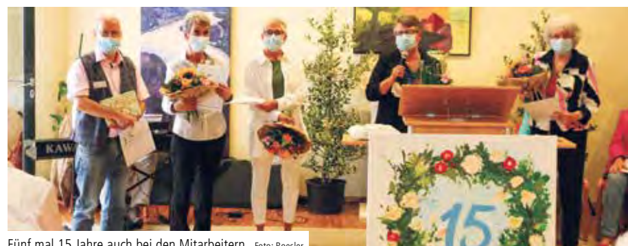
Fünf mal 15 Jahre auch bei den Mitarbeitern

ANDERNACH. Unter dem Motto „Im Wandel der Zeit“ feierte das Seniorenzentrum Katharina Kasper in Andernach in der Woche vom 13. bis 17. September 2021 sein 15-jähriges Jubiläum. Neben verschiedenen Tagesangeboten für Bewohner, Angehörige und Freunde des Hauses stand der feierliche Festakt am 15. September im Mittelpunkt der