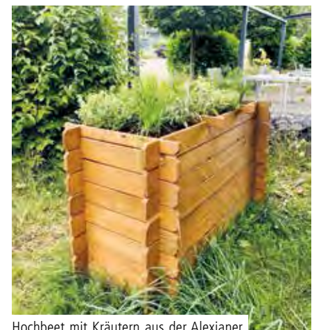
Hochbeet mit Kräutern aus der Alexianer Klostersgärtnerei

Insgesamt wurde das Hochbeet mit 13 Kräutern bepflanzt, darunter mit Klassikern wie Schnittlauch oder Dill, aber auch mit Ausgefallenerem wie dem grün-weißen Zitronenthymian. Die Pflanzen stammen aus der Alexianer Klostersgärtnerei. In der Werkstatt in Kalk wird jeden Tag frisch gekocht, künftig nun auch mit tagesfrischem Eigengewächs. In den Gruppenstunden wurden die einzelnen Tätigkeiten rund um das Kräuterhochbeet im Nachgang besprochen und unter den Beschäftigten aufgeteilt.