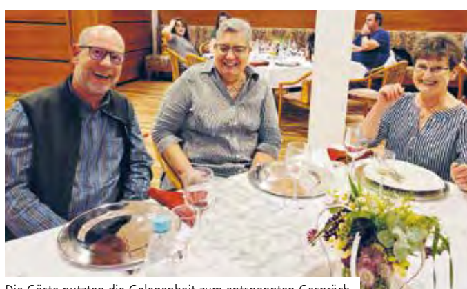
Die Gäste nutzten die Gelegenheit zum entspannten Gespräch