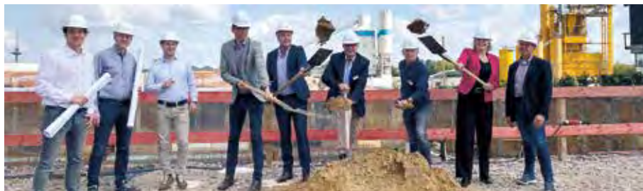
Mit dem symbolischen Spatenstich haben die Bauarbeiten für den Neubau der Alexianer Zentralschule für Gesundheitsberufe am Dreieckshafen offiziell begonnen

Bereits zu Beginn der Sommerferien war die Baustelle eingerichtet worden, die nun für zwei Jahre das Bild am Dreieckshafen bestimmen wird. Auf der rund 4.000 Quadratmeter