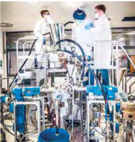
Einblicke in die Misch- und Beschichtungsanlage im Reinraum des „AlexProWerkes“ der Alexianer Werkstätten Münster

Fraunhofer startet Forschungsbetrieb bei den Alexianer Werkstätten