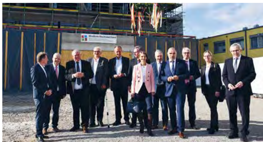
Im Beisein von Gesundheitsminister Laumann (3. v. l.) und weiteren Ehrengästen wurde das Richtfest gefeiert

Für die Menschen im Hochsauerlandkreis (HSK) bedeutet das 88-Millionen-Projekt eine Verbesserung der medizinischen Versorgung. Denn bisher gibt es im HSK und weit darüber hinaus kein Krankenhaus, das so viele Fachabteilungen und Kompetenzen in sich vereint, dass eine umfassende