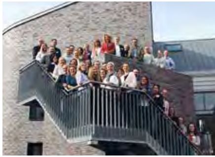
Gute Stimmung, intensiver Austausch und gegenseitiges Kennenlernen bei der Tagung aller Alexianer-Kommunikatoren

2.0 – Tagung der Unternehmenskommunikation in Münster