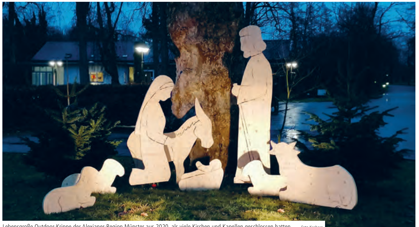
Lebensgroße Outdoor-Krippe der Alexianer-Region Münster aus 2020, als viele Kirchen und Kapellen geschlossen hatten

Beim Strategieprozess 2025 hat die Umsetzung begonnen. Die Alexianer haben sich mit Beginn des Jahres strukturell neu aufgestellt: In den obersten beiden Gremien – Stiftungskuratorium und Aufsichtsrat – haben wir neue Mitglieder begrüßen dürfen. Die Führungsstruktur des Unternehmens wurde durch die Erweiterung der Hauptgeschäftsführung und die