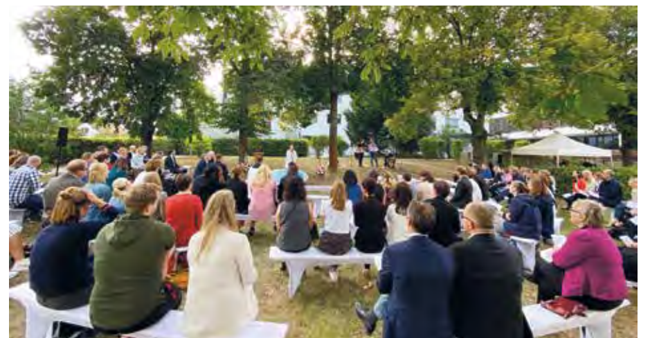
Während des Gottesdienstes zwischen der historischen Villa und dem modernen Hauptgebäude

Die Alexianer St. Hedwig Kliniken zählen mit ihren Häusern, dem St. Hedwig-Krankenhaus und dem Krankenhaus Hedwigshöhe, zu den beliebtesten Allgemeinkrankenhäusern der Hauptstadt. Sie bieten auf mehreren Gebieten Spitzenmedizin und belegen seit vielen Jahren vordere Plätze in landes- und bundesweiten Krankenhausrankings. Pünktlich zum Jubiläumsjahr 2021 wurden die St. Hedwig Kliniken Berlin vom Magazin Newsweek gar mit dem Siegel „World's Best Hospitals“ ausgezeichnet. ✓ (stm)