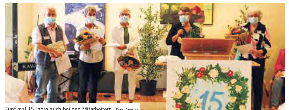
Fünf mal 15 Jahre auch bei den Mitarbeitern.

ANDERNACH. Unter dem Motto „Im Wandel der Zeit“ feierte das Seniorenzentrum Katharina Kasper in Andernach in der Woche vom 13. bis 17. September 2021 sein 15-jähriges Jubiläum. Neben verschiedenen Tagesangeboten für Bewohner, Angehörige und Freunde des Hauses stand der feierliche Festakt am 15. September im Mittelpunkt der