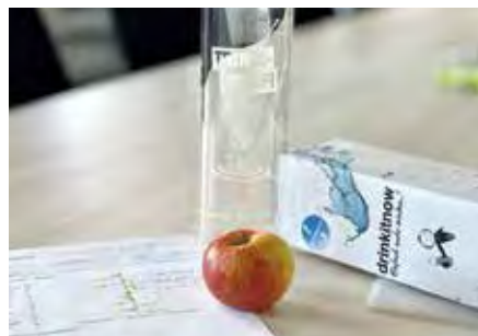
Gezielte Präventions- und Beratungsangebote für die Kolleginnen und Kollegen

Beim Onlinekurs „Achtsamkeit und Entspannungstraining“ konnten die Mitarbeitenden beispielsweise bequem von zu Hause aus verschie-