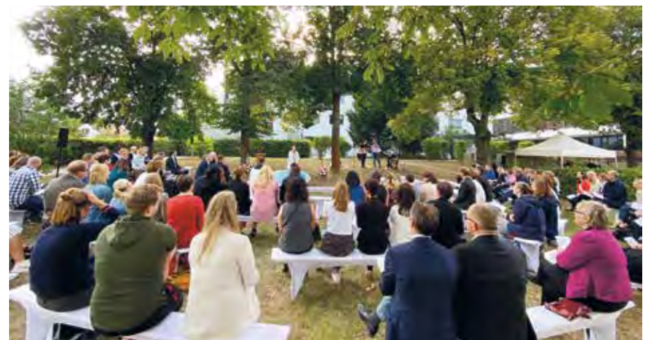
Während des Gottesdienstes zwischen der historischen Villa und dem modernen Hauptgebäude

Die Alexianer St. Hedwig Kliniken zählen mit ihren Häusern, dem St. Hedwig-Krankenhaus und dem Krankenhaus Hedwigshöhe, zu den beliebtesten Allgemeinkrankenhäusern der Hauptstadt. Sie bieten auf mehreren Gebieten Spitzenmedizin und belegen seit vielen Jahren vordere Plätze in landes- und bundesweiten Krankenhausrankings. Pünktlich zum Jubiläumsjahr 2021 wurden die St. Hedwig Kliniken Berlin vom Magazin Newsweek gar mit dem Siegel „World's Best Hospitals“ ausgezeichnet. ✓ (stm)