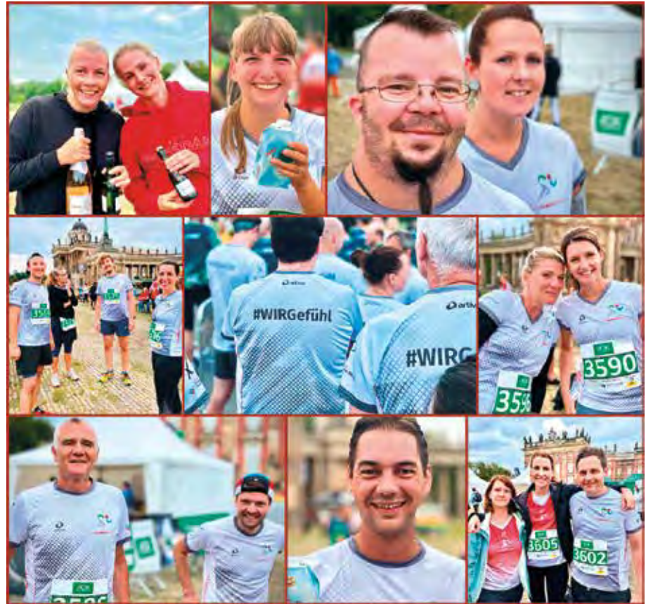
Auf der „Mopke“ am Neuen Palais wurden von den „SchrittMachern“ Topzeiten eingefahren