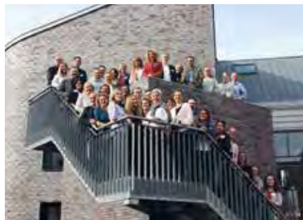
Gute Stimmung, intensiver Austausch und gegenseitiges Kennenlernen bei der Tagung aller Alexianer-Kommunikatoren

2.0 – Tagung der Unternehmenskommunikation in Münster