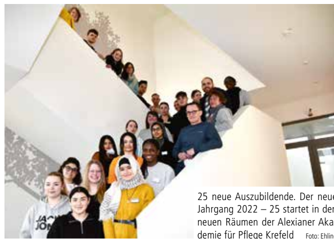
25 neue Auszubildende. Der neue Jahrgang 2022 – 25 startet in den neuen Räumen der Alexianer Akademie für Pflege Krefeld