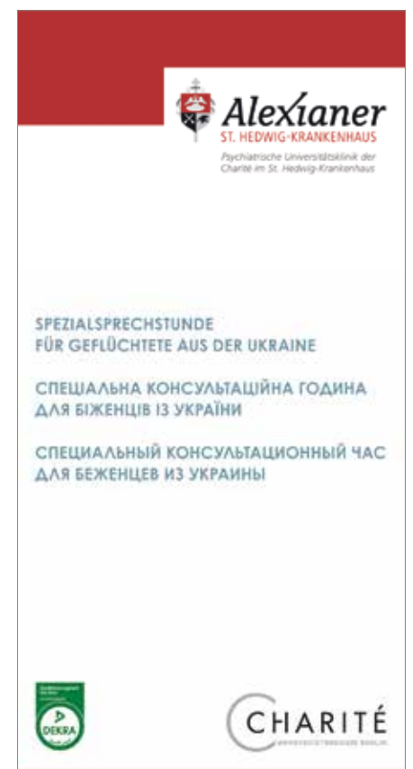
Titelblatt des Flyers der Spezialsprechstunde für Geflüchtete

Spendenkonto Alexianer GmbH: Kontoinhaber: Alexianer St. Hedwig Kliniken Berlin GmbH Kreditinstitut: Pax-Bank eG IBAN: DE49370601936000650100 BIC: GENODED1PAX Spendenkennwort: Hilfe Ukraine