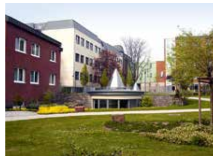
Das Krankenhaus Maria-Hilf Krefeld

und die Station M 9 für Patientinnen und Patienten nach geriatrischer Erstbeurteilung (Assessment) mit primär somatischen Erkrankungen werden für die heutigen und künftigen Anforderungen an eine aktivierende Behandlung und Pflege fit gemacht. Ziel ist es dabei, die betagten Patientinnen und Patienten aus dem Krankenhaus wieder in ein würdevolles und möglichst selbstbestimmtes Leben zurückzuführen. Die Inhalte der Umbauten sind umfassend. Alle Bereiche, also Patientenzimmer, Sanitäreinrichtungen, Aufenthalts- und Therapieräume sowie Verkehrsflächen werden altersgerecht umgestaltet. Die