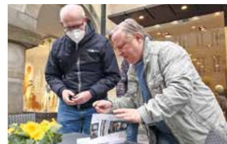
Der Autor (l.) im Gespräch über den „Krimiführer Münster“ mit dem Schauspieler Axel Prah („Hauptkommissar Thiel“, Tatort)

Nach zweieinhalb Jahren Arbeit ist sein „Krimiführer Münster“ nun gedruckt im Buchhandel und unter