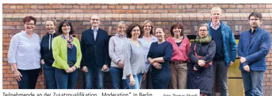
Teilnehmende an der Zusatzqualifikation „Moderation“ in Berlin

Die Weiterbildung will Mitarbeitende mit unterschiedlichem beruflichen Erfahrungshintergrund für die Aufgaben der Moderation ethischer Fallbespre-