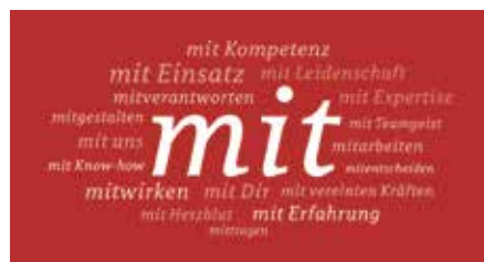
Grafik zur Kampagne