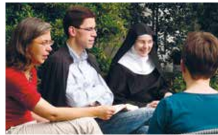
Auseinandersetzung mit Glauben und Spiritualität in der Benediktinerinnen-Abtei Varenzell