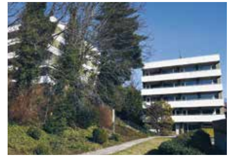
Zwei Wohnheime am Marienhospital sowie ein Wohnheim am St. Walburga-Krankenhaus bieten Unterkunft für 312 Vertriebene

Als Zeichen der Solidarität hat das Klinikum Hochsauerland Ende Februar 2022 ein erstes medizinisches Hilfspaket auf den Weg in die Krisenregion gebracht. Anfang März folgte dann die Beteiligung an einer Hilfsaktion aus dem Verbund der Alexianer für ein