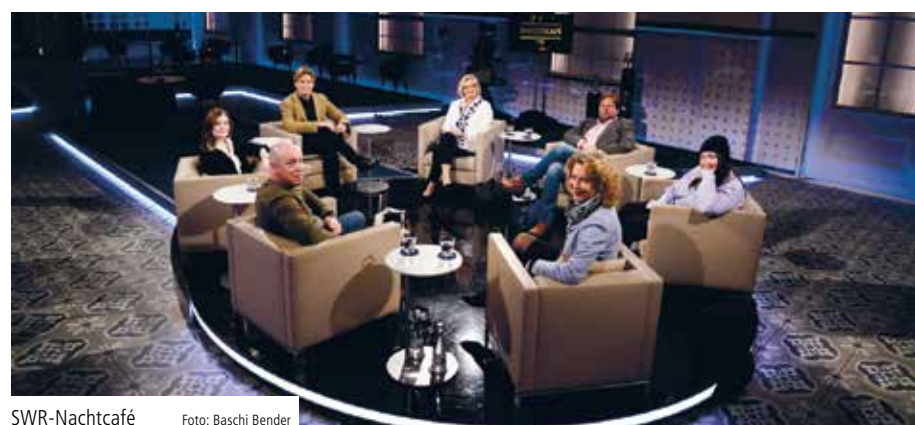
SWR-Nachtcafé