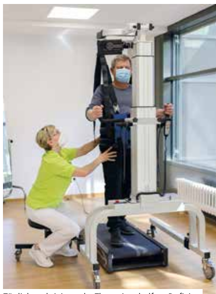
Tägliche aktivierende Therapien helfen Defizite schnellstmöglich nach dem Akutereignis zu überwinden

„Die neurologische Frührehabilitation der Phase B ermöglicht noch in der Zeit der akuten stationären Krankenhausbehandlungsnotwendigkeit den unmittelbaren Beginn aktivierender Therapien, um frühestmöglich die