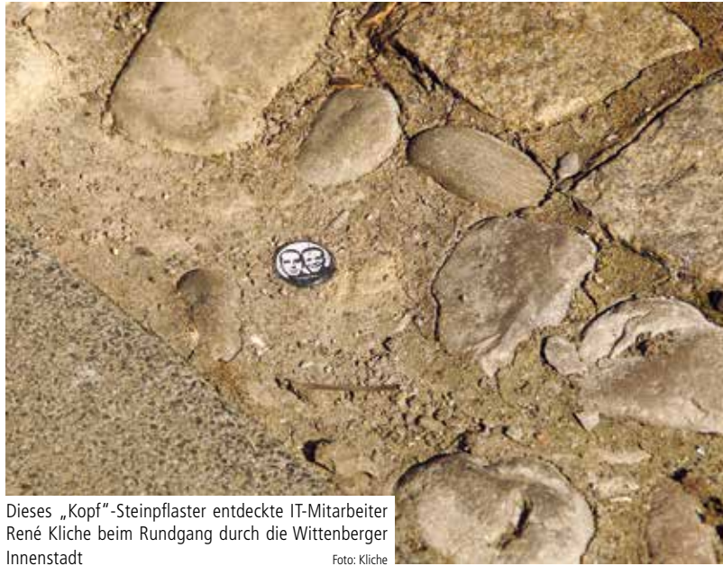
Dieses „Kopf“-Steinpflaster entdeckte IT-Mitarbeiter René Kliche beim Rundgang durch die Wittenberger Innenstadt

die spirituelle Aussage für den Betrachter auf dem ersten Blick.