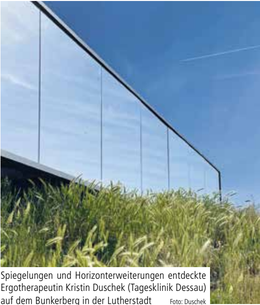
Spiegelungen und Horizontenerweiterungen entdeckte Ergotherapeutin Kristin Duschek (Tagesklinik Dessau) auf dem Bunkerberg in der Lutherstadt