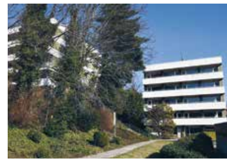
Zwei Wohnheime am Marienhospital sowie ein Wohnheim am St. Walburga-Krankenhaus bieten Unterkunft für 312 Vertriebene

Als Zeichen der Solidarität hat das Klinikum Hochsauerland Ende Februar 2022 ein erstes medizinisches Hilfspaket auf den Weg in die Krisenregion gebracht. Anfang März folgte dann die Beteiligung an einer Hilfsaktion aus dem Verbund der Alexianer für ein