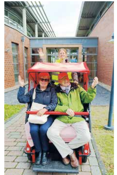
Das Angebot der Rikschafahrten wurde gern genutzt

Unter diesem Motto organisierte das Demenzzetz Porz in diesem Jahr eine Veranstaltung im Rahmen der neunten Kölner Demenzwoche.