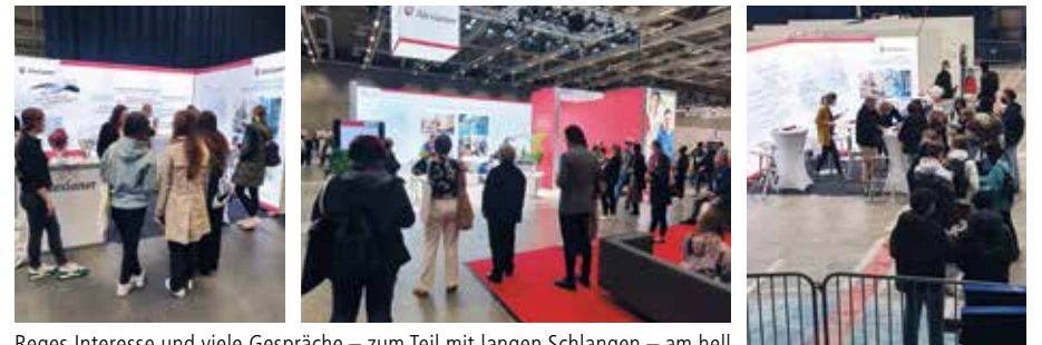
Reges Interesse und viele Gespräche – zum Teil mit langen Schlangen – am hell erleuchteten Messestand der Alexianer

Raum für zahlreiche Gespräche und viel Aufmerksamkeit