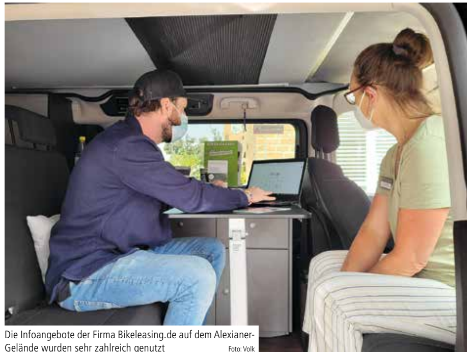
Die Infoangebote der Firma Bikeleasing.de auf dem Alexianer-Gelände wurden sehr zahlreich genutzt

Wie genau Bikeleasing funktioniert, darüber informiert ein Flyer auf der Intranetseite der Kölner Alexianer. ✕ (kv)