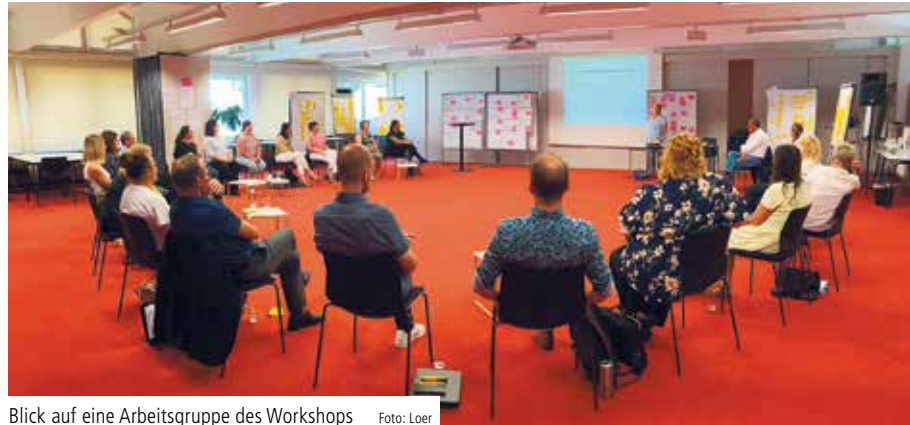
Blick auf eine Arbeitsgruppe des Workshops

Teilgenommen haben – abhängig vom Geschäftsfeld – Einrichtungs- und Pflegedienstleitungen, Mitglieder der Betriebsleitungen sowie ärztliche und pflegerische Mitarbeitende mit Führungsverantwortung, aber auch Mitarbeitende der Holding. Auffällig, jedoch wenig überraschend stand für jeden Geschäftsbereich das Thema Personal-