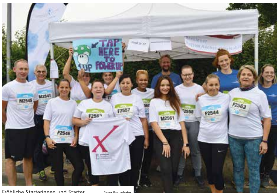
Fröhliche Starterinnen und Starter

„Der Aachener Firmenlauf ist immer eine tolle Veranstaltung! Stimmung und Atmosphäre sind phantastisch. Ein Sportevent, bei dem die Freude an der Bewegung und das Gefühl der Zusammengehörigkeit im Vordergrund stehen – und nicht in erster Linie der sportliche Ehrgeiz. Hier zählt jede sportliche Leistung – unabhängig von Runden und Zeiten“, erzählt