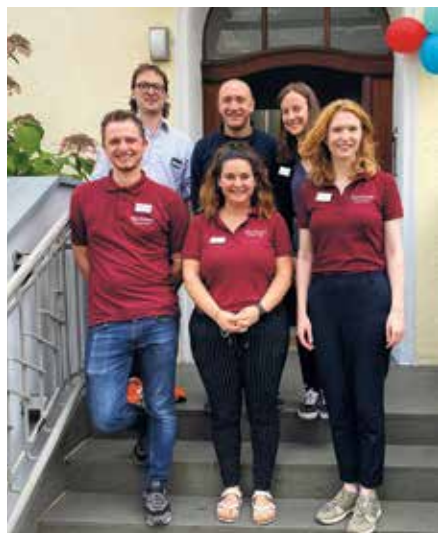
Freuen sich auf die Arbeit in den neuen Räumen: Die Teams der Alexianer-Ergotherapie und der Anlaufstelle ZenE

Tag der offenen Tür in der Ergotherapiepraxis Bayenthal