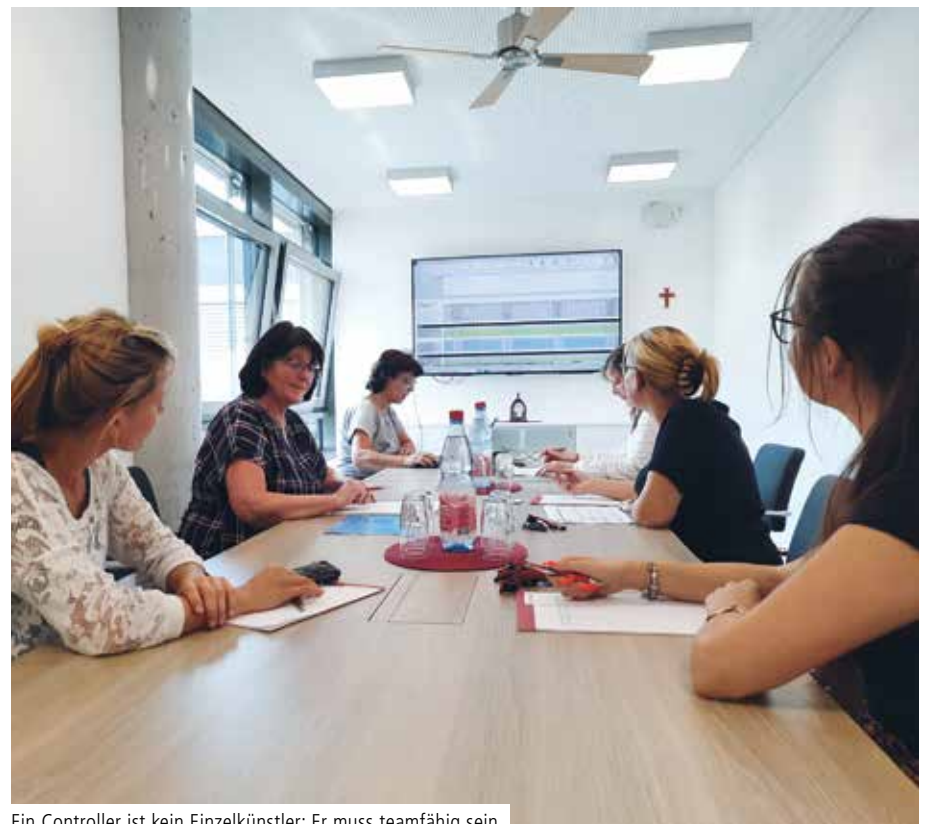
Ein Controller ist kein Einzelkünstler: Er muss teamfähig sein, da oft gemeinsam an Projekten gearbeitet wird

Die Krankenhauslandschaft soll sich nach den Vorstellungen der Regierung deutlich verändern. Mittlerweile gibt es so viele Gesetzesänderungen und Erweiterungen, dass es kaum noch möglich ist, einen Überblick zu behalten, um alle Pflichten fristgerechter Abgaben einzuhalten. Daraus ergibt sich die Herausforderung, eine Waage zwischen der Versorgungssicherheit der Patienten auf der einen und der finanziellen Sicherung der Krankenhausstandorte auf der anderen Seite zu finden. Der Konzern nutzt bereits Synergien im Rahmen der Dezentralisierungen.