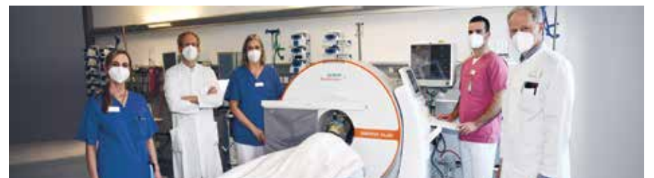
Im Klinikum Hochsauerland können schwerkranke Patienten direkt auf der Intensivstation per Kopf-CT-Bildgebung untersucht werden

auf der Intensivstation. Der mobile CT gestattet direkte und schnelle Diagnosen, ohne den Patienten aus der intensivmedizinischen Umgebung in die Radiologie und zurück transportieren zu müssen. Transportbedingte Risiken und Unannehmlichkeiten werden vermieden.